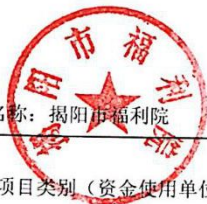
2017年部门预算项目支出及其他支出预算表