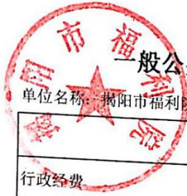
一般公共预算安排的行政经费及“三公”经费预算表