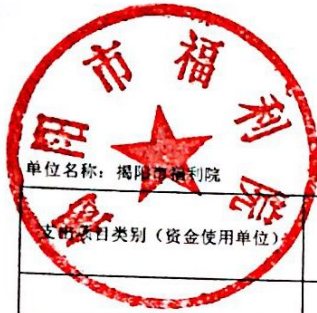
2017年部门预算基本支出情况表