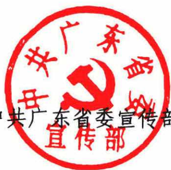
中共广东省委宣传部