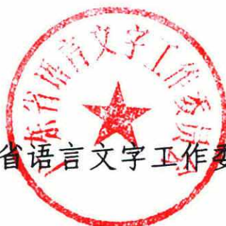
广东省语言文字工作委员会