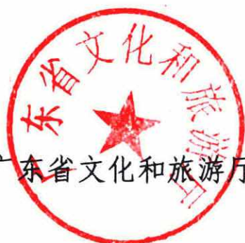
广东省文化和旅游厅