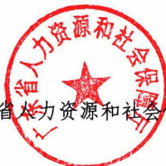
广东省人力资源和社会保障厅