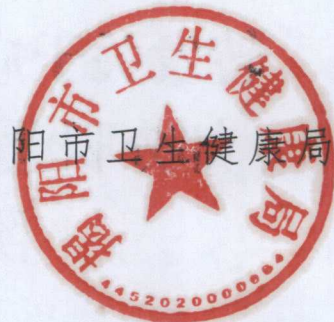
揭阳市卫生健康局