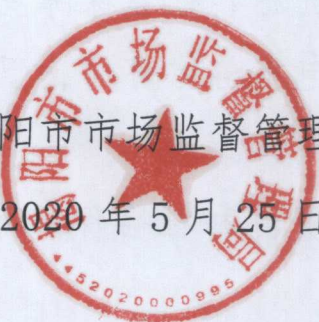
揭阳市市场监督管理局