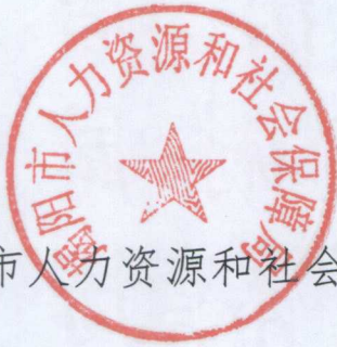
揭阳市人力资源和社会保障局

业农村厅 文化和旅游厅 卫生健康委员会 市场监督管理局 《关于应对新冠肺炎疫情影响实施部分职业资格“先上岗、 再考证”阶段性措施的通知》（粤人社发〔2020〕88号）转 发给你们，请按规定认真贯彻落实。