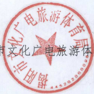
揭阳市文化广电旅游体育局