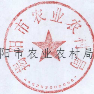
揭阳市农业农村局