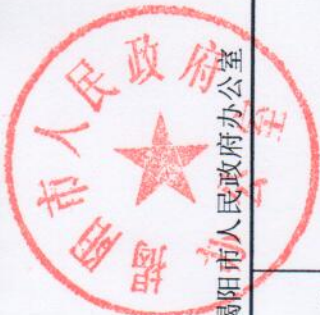
一般公共预算财政拨款收入支出决算批复表