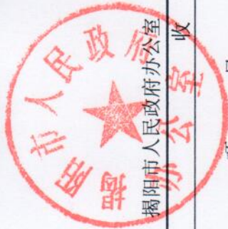
财政拨款收入支出决算批复表