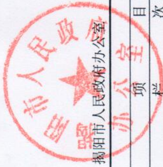
收入支出决算批复表