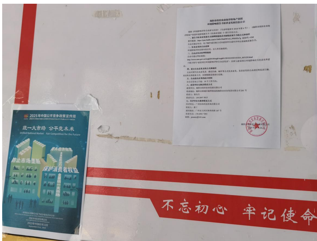
图 3-4 (A) 张贴公示图 (建设单位公告栏)