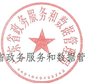
广东省政务服务和数据管理局