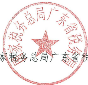
国家税务总局广东省税务局