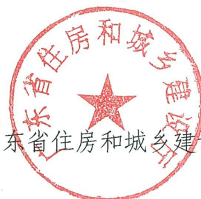
广东省住房和城乡建设厅