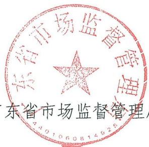
广东省市场监督管理局