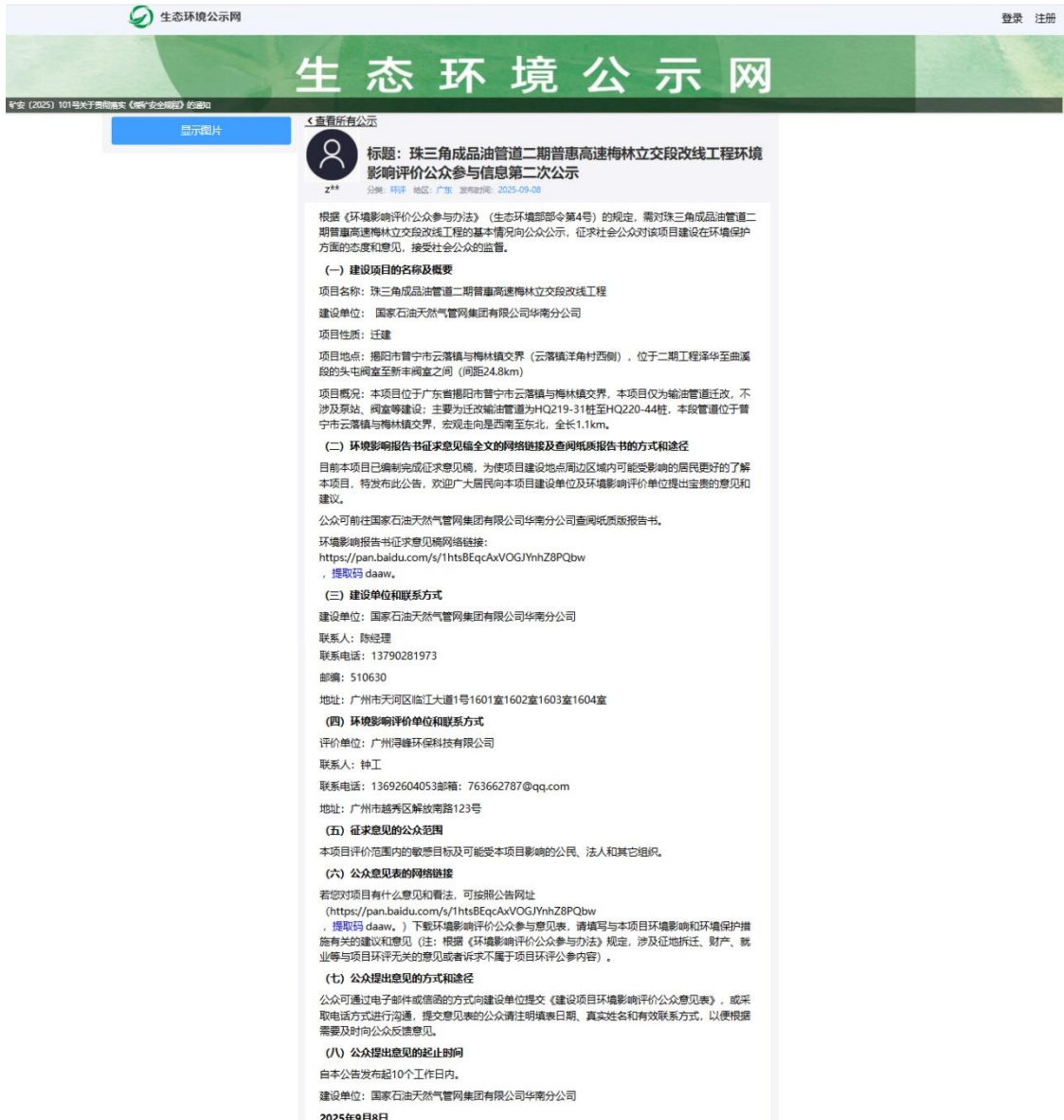
图 5.3-1 征求意见稿网上公示信息截图