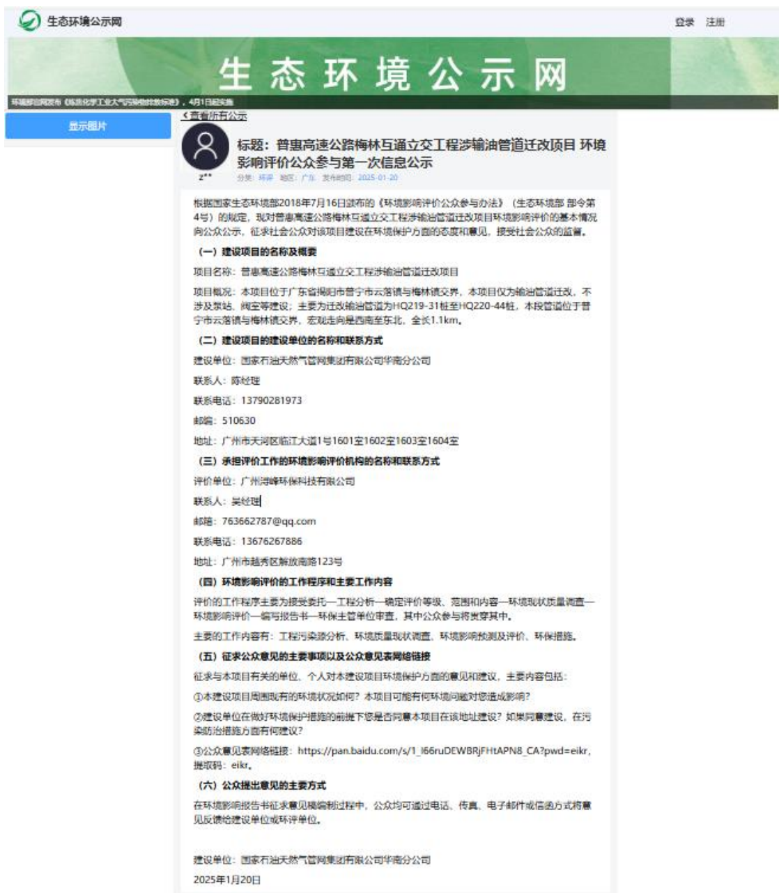
图 4.3-1 首次环境影响评价信息公开截图