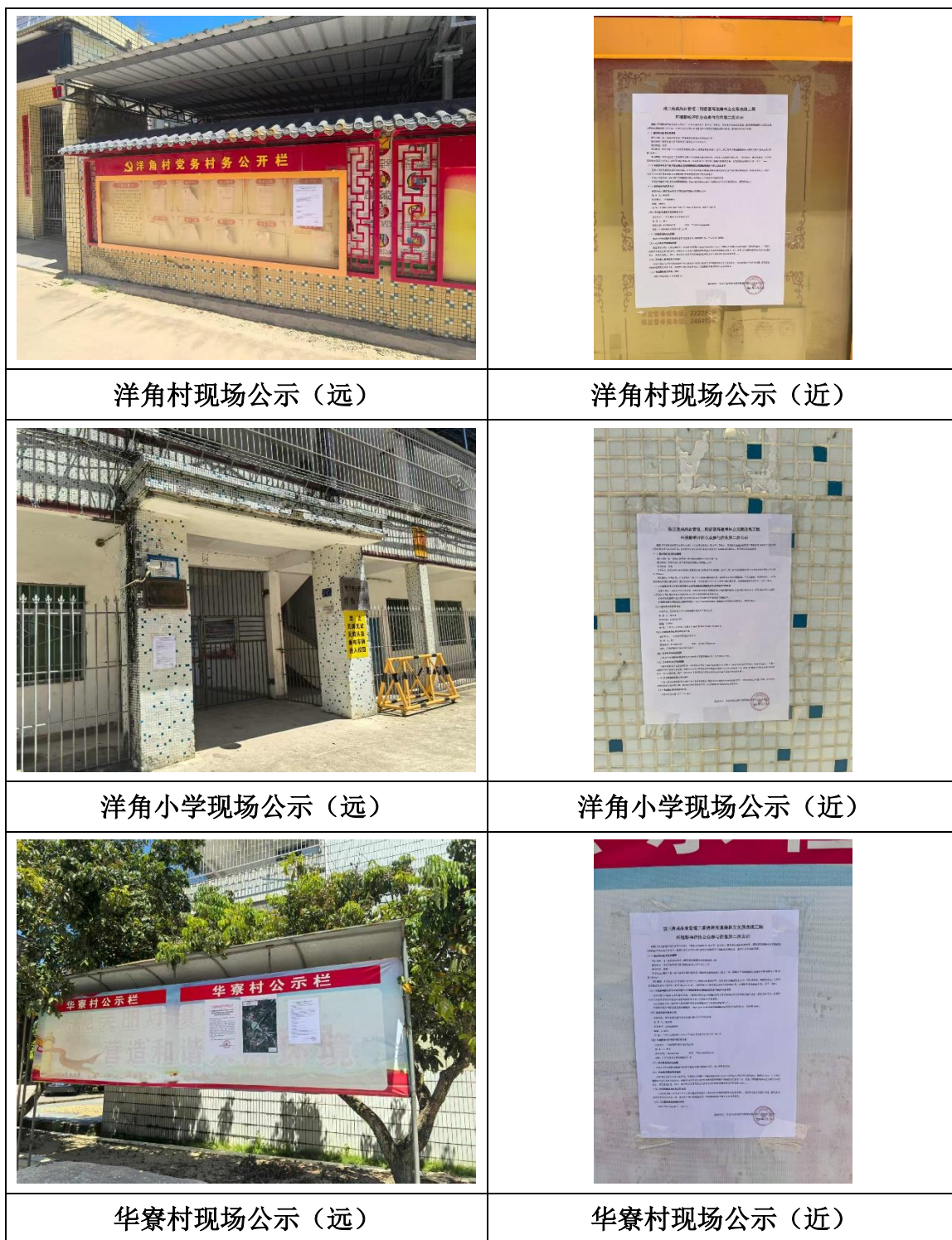
图 5.3-4 现场公示照片