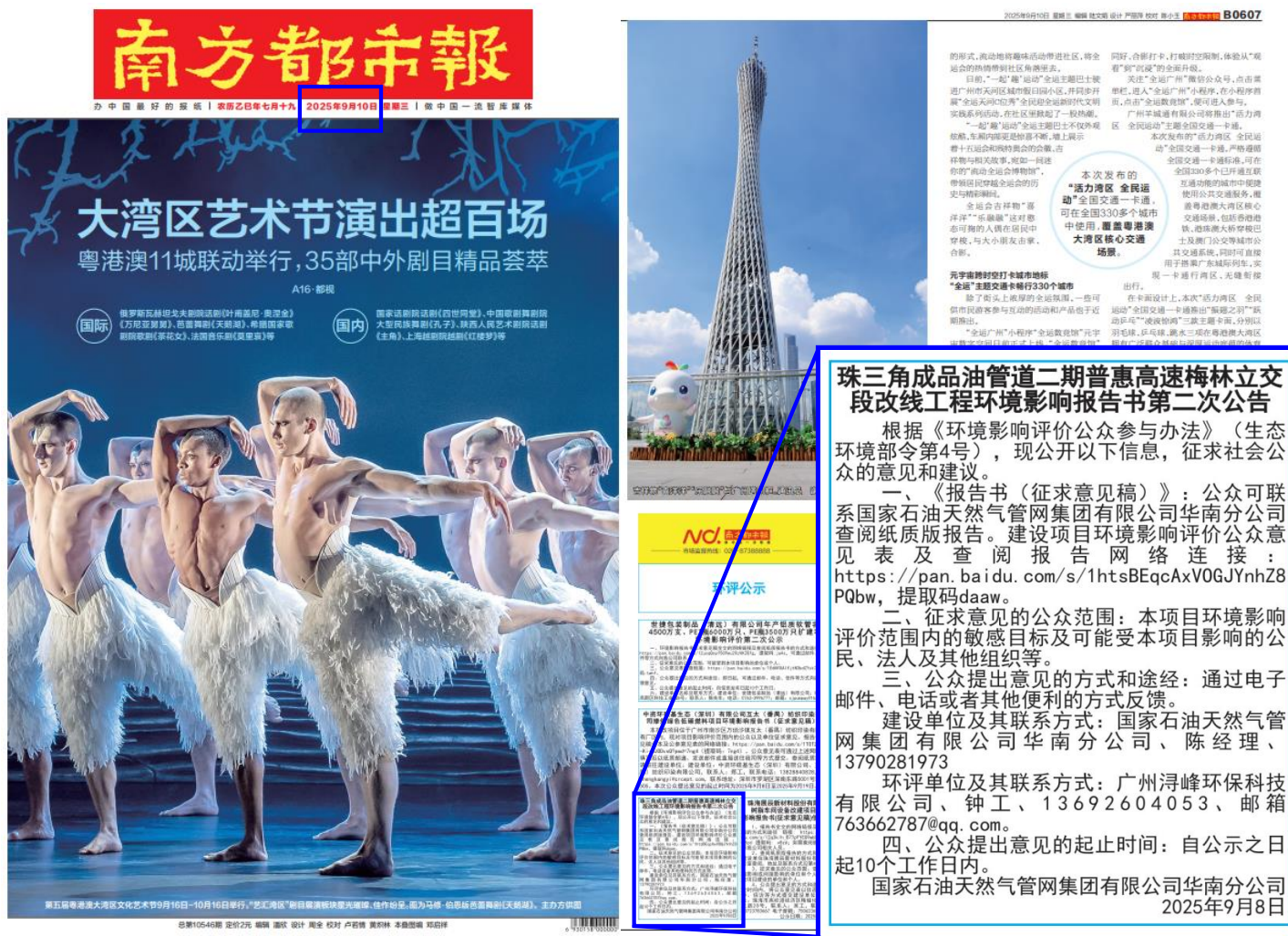
图 5.3-2 征求意见稿第一次报纸公示信息（2025 年 9 月 10 日）