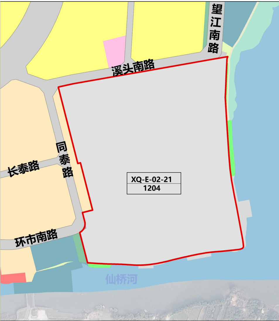
XQ-E-02-21地块土地利用规划图