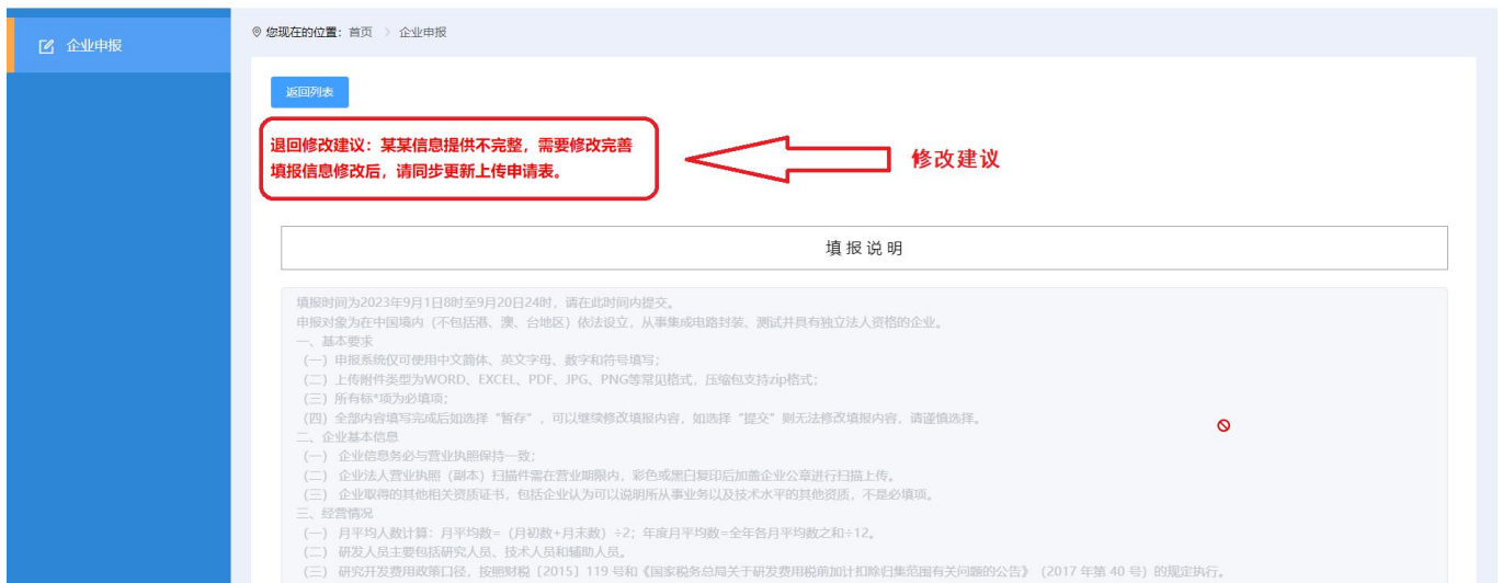
图 2-4 企业申报-退回修改

注意：申报企业提交数据之后不能主动撤回，需要由地方行业主管部门审核退回。申报企业应认真检查申报的资料内容，珍惜每次修改和提交机会，尽量减少不必要的重复申报和审核。