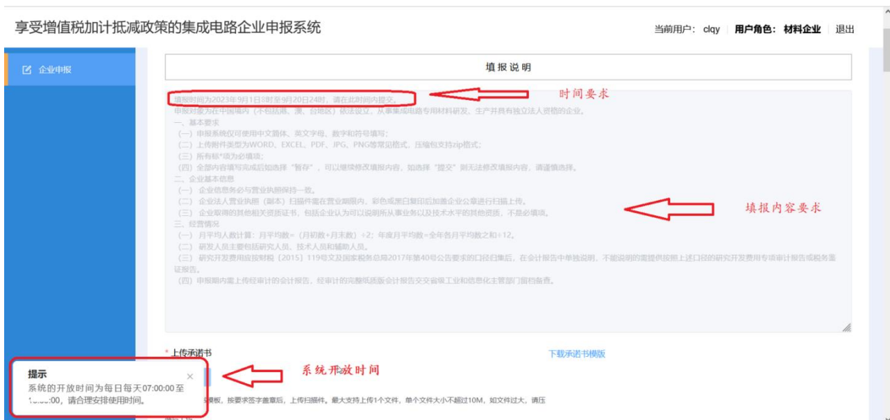
图 2-9 填报时间