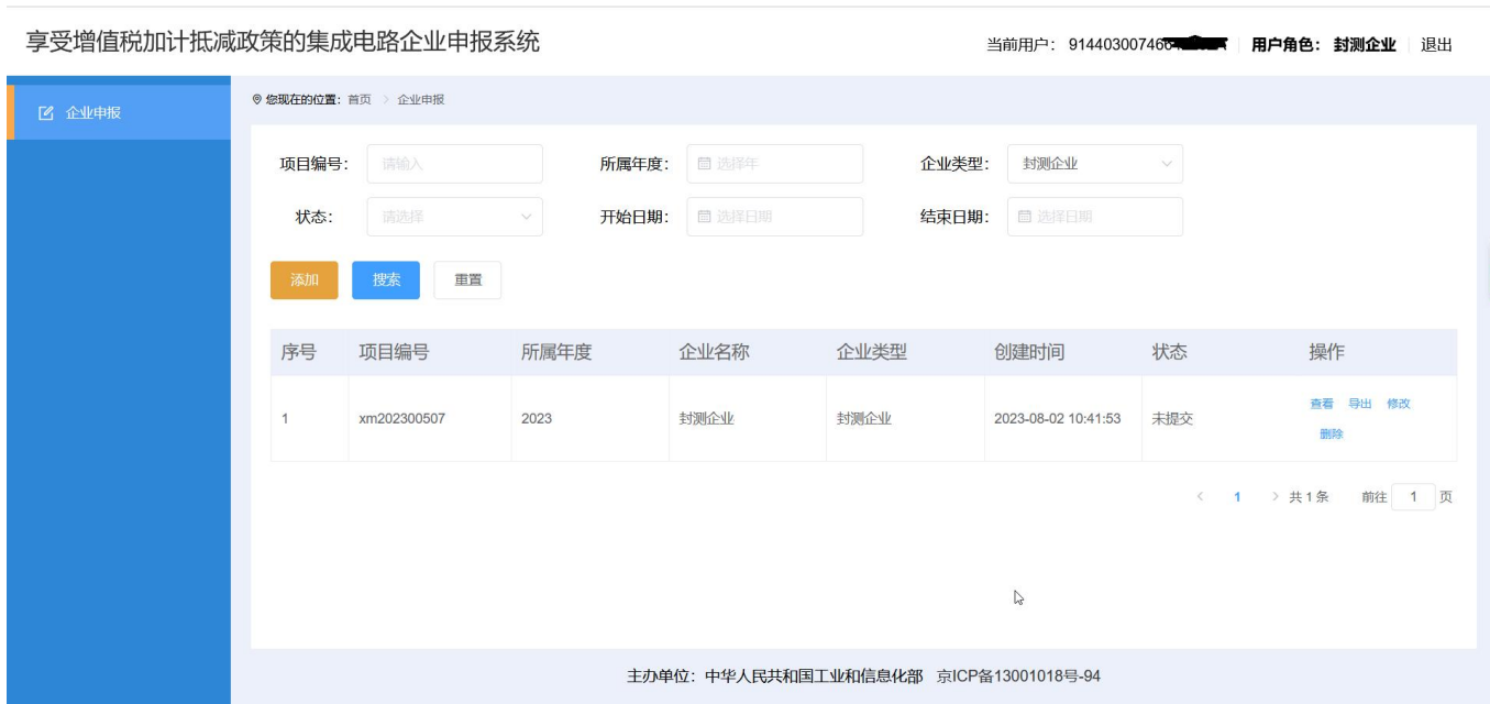
图 2-3 企业申报-列表页面

建议：因填报和提交的扫描文件较多，相关内容可能需要公司多个部门协同完成。建议正式申报之前，应点击【添加】按钮，记录申报页面需要填报和上传的文件，分发给各部门筹备，指定负责人收集相关资料后统一进行申报操作。