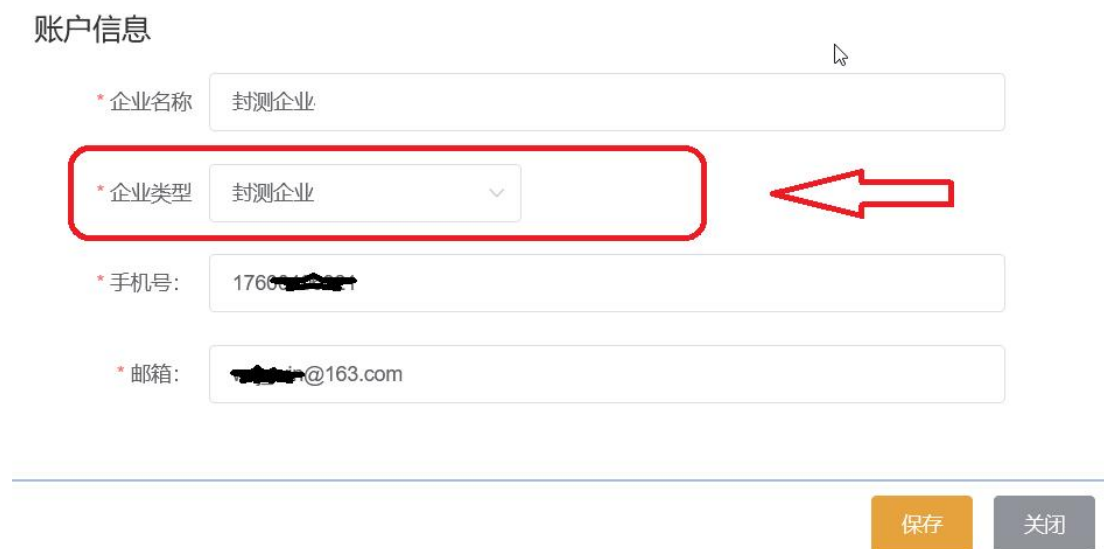
图 2-15 账号信息-修改企业类型

2. 账号信息中修改“企业类型”。点击“登录名”对应的信用代码链接后，弹出账号信息修改页面，选择正确“企业类型”后，点击【保存】按钮，确认修改。