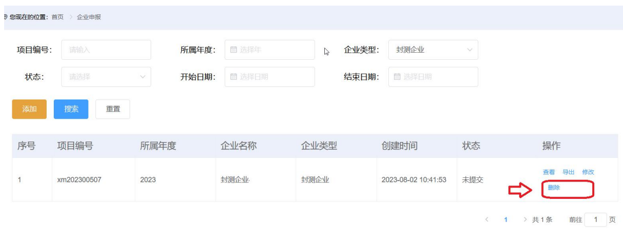
图 2-14 列表页面-删除

2. 账号信息中修改“企业类型”。点击“登录名”对应的信用代码链接后，弹出账号信息修改页面，选择正确“企业类型”后，点击【保存】按钮，确认修改。