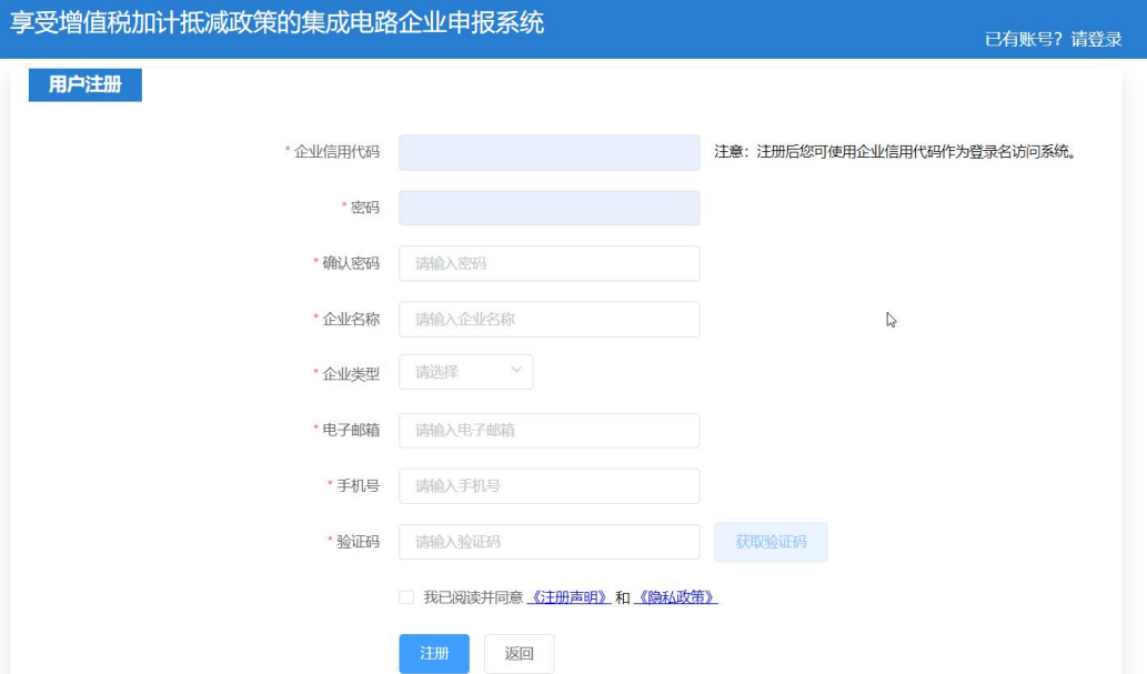
图 2-1 注册页面

如果输入“企业信用代码”后，提示“企业信用代码已经存在”，说明该企业已完成注册，应及时做好内部沟通，特殊情况请联系系统技术单位解决。