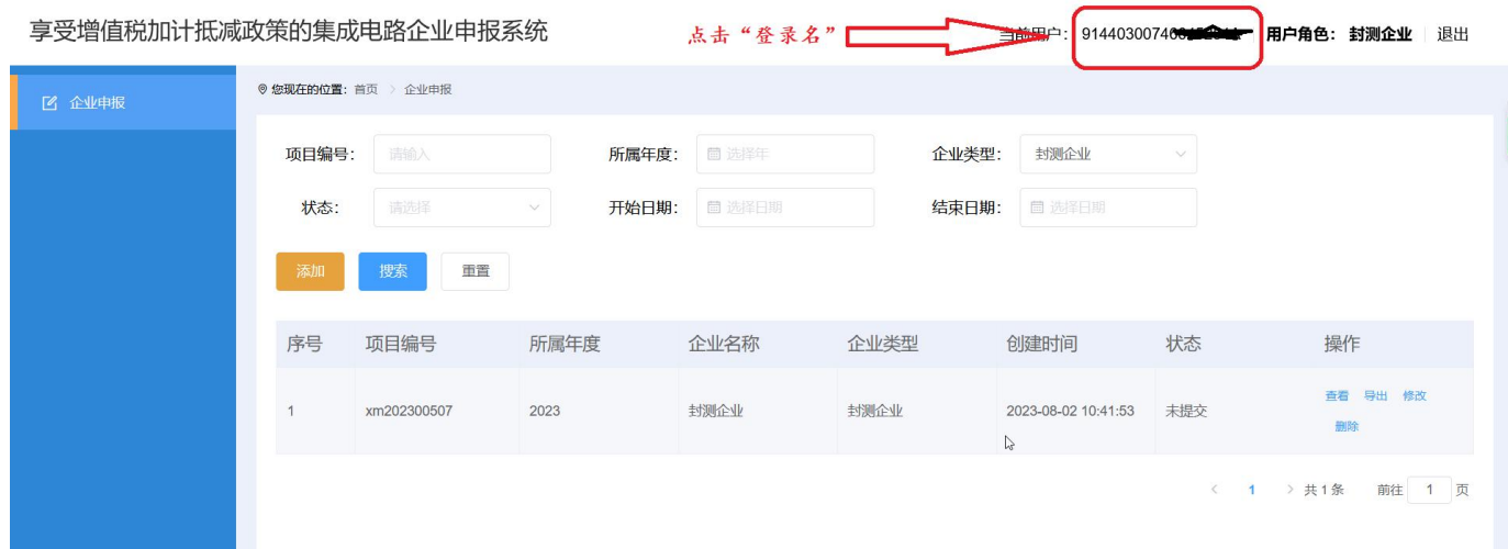
图 2-10 账号信息-展示页面

企业名称、企业类型、手机号、邮箱等账号信息需要修改时，可以点击右上角顶部的登录名进入修改页面。