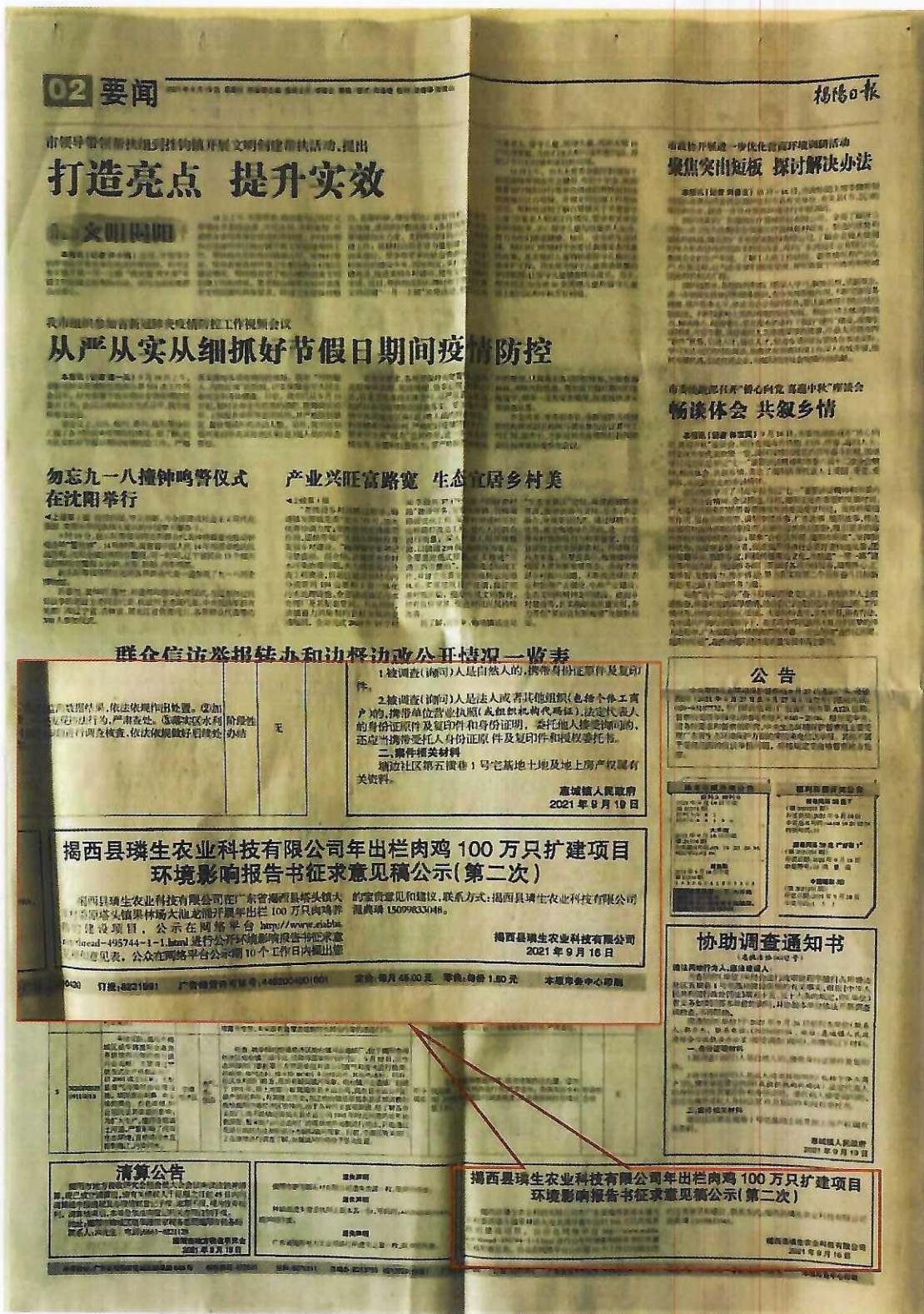
图 4 第二次报纸公示