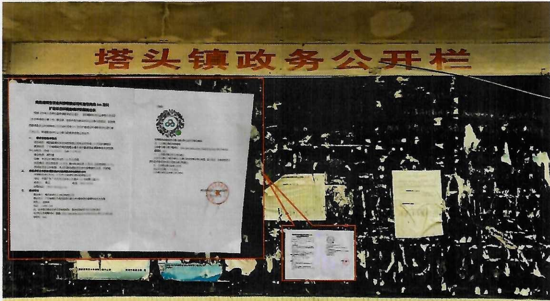
图6 塔头镇张贴照片