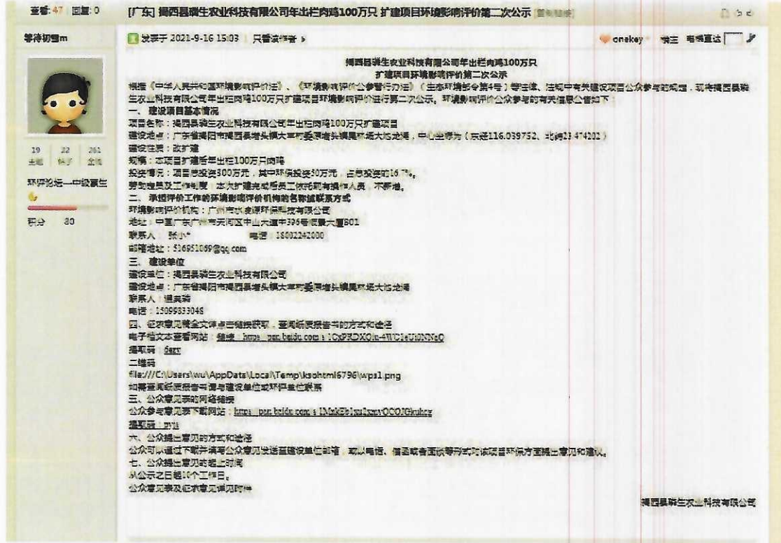
图2 第二次网络公示截图