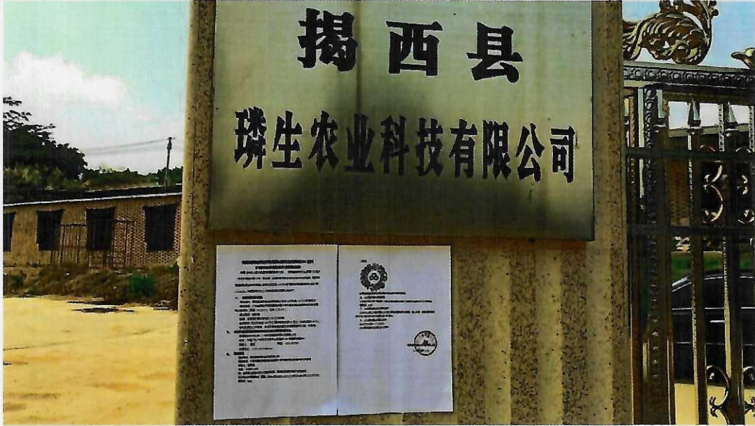
图5 养殖场张贴照片

公开栏和揭西县塔头镇大丰村宣传栏，为所在地公众易于知悉的场所，符合《环境影响评价公众参与办法》（生态环境部令第4号）第十一条有关要求。张贴时间为2021年8月19日起10个工作日。现场张贴照片如下图。