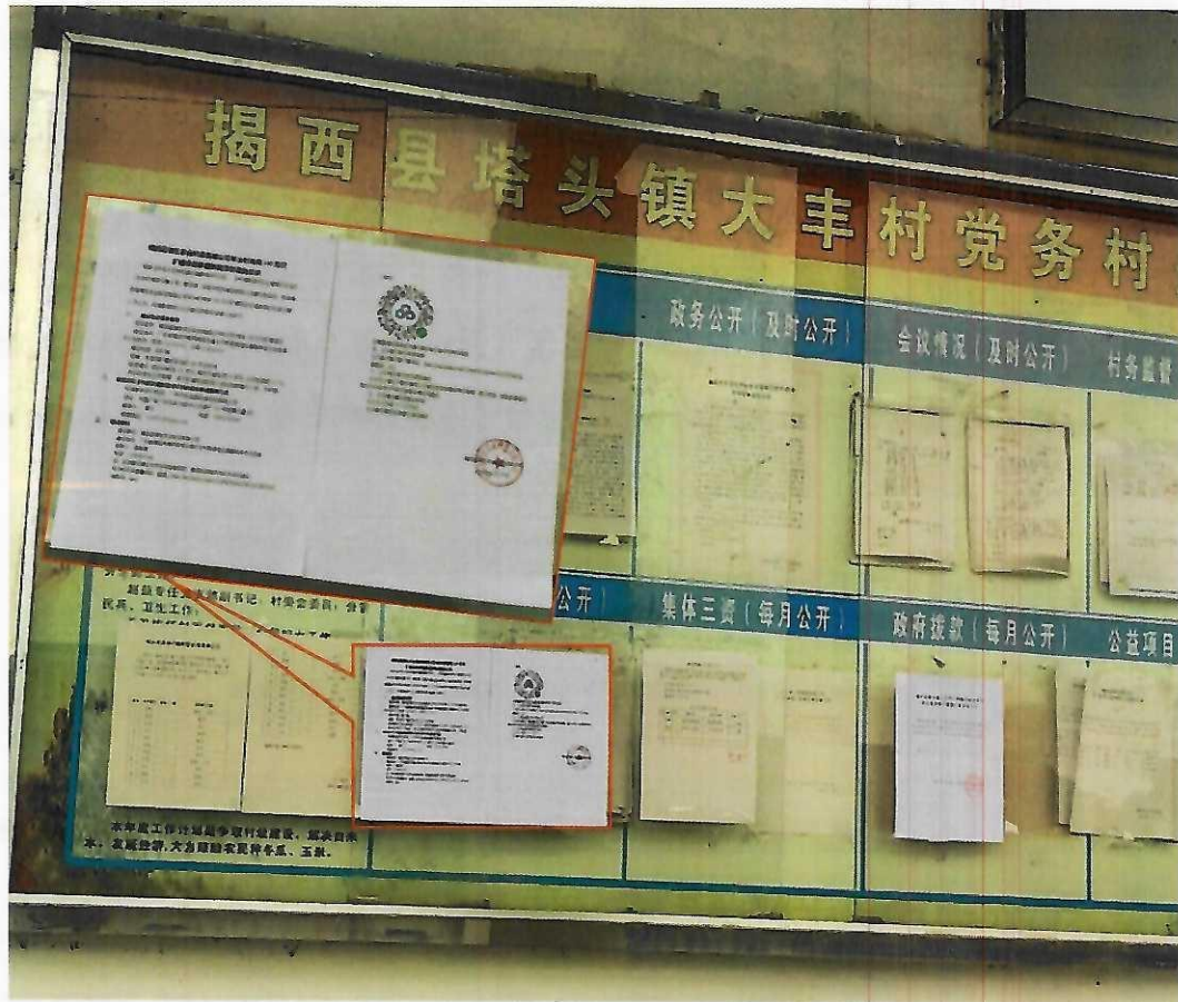
图 7 揭西县塔头镇大丰村张贴照片