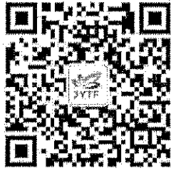
揭阳市科技金融 服务中心