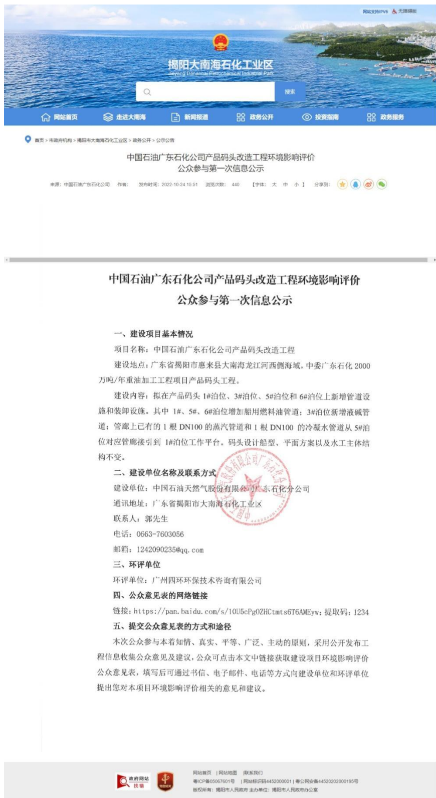
图2.1-1 第一次公示网络截图