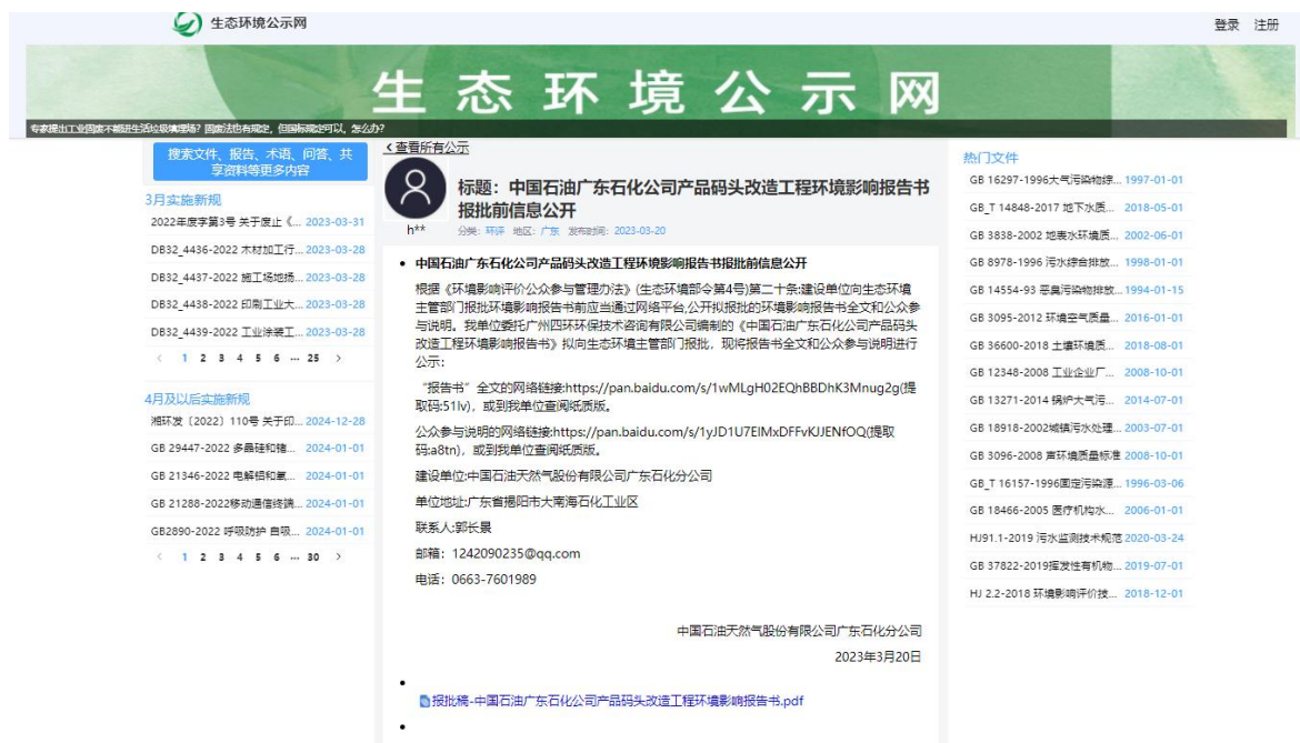
图 6.2-1 报批前公示截图

报告书报批前公示(第三次公示)在生态环境公示网进行公示，公示时间为2022年3月20日，公示截图见图6.2-1所示，公示网址为 https://gongshi.qsyhbgi.com/h5public-detail?id=329722 ，符合《环境影响评价公众参与办法》(生态环境部令部令 第4号)中关于报告书报批前公示的要求。