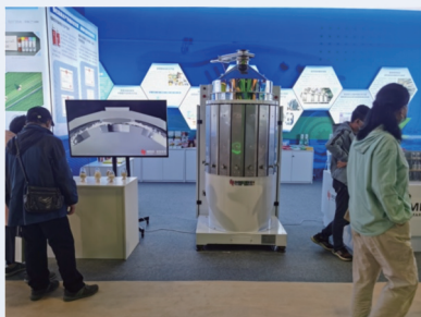
入选“国家‘十三五’科技创新成就展”

核心成果柔性碾米机，采用柔性砂带替代已一个半世纪的刚性碾米砂辊或铁辊，大米出品率可提升 5~8 个百分点以上。与传统碾米机相比，加工籼米时碎米率下降 6 个百分点以上(粳米碎米率下降 3 个百分点以上)，吨米电耗下降 10kW·h，糙米加工成白米时米粒温度上升幅度下降 15℃以上，调整参数还可生产留胚米。技术评价结论“达到国际领先水平”。