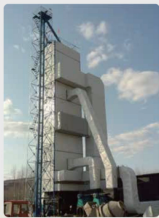
空气源热泵粮食干燥机实物图