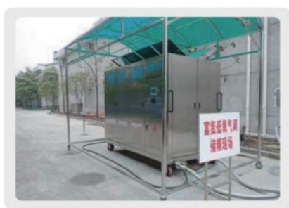
膜分离氮气循环气调储粮现场图