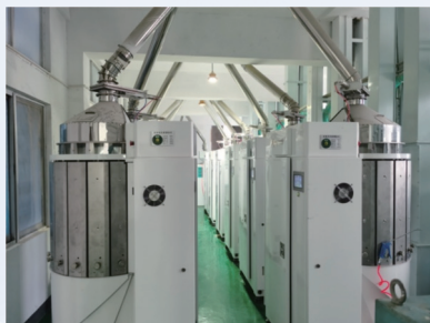
大米车间应用现场之一