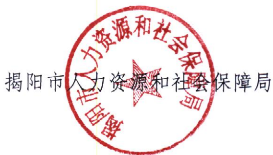
揭阳市人力资源和社会保障局