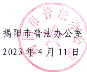
揭阳市普法办公室