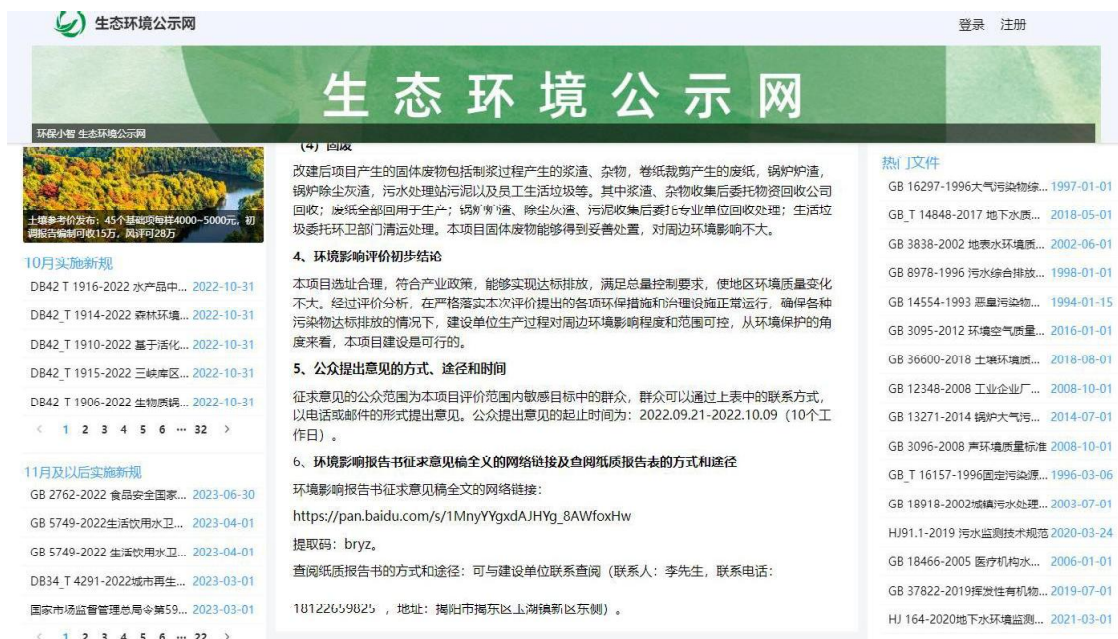
图 3-1 征求意见稿网络公示截图