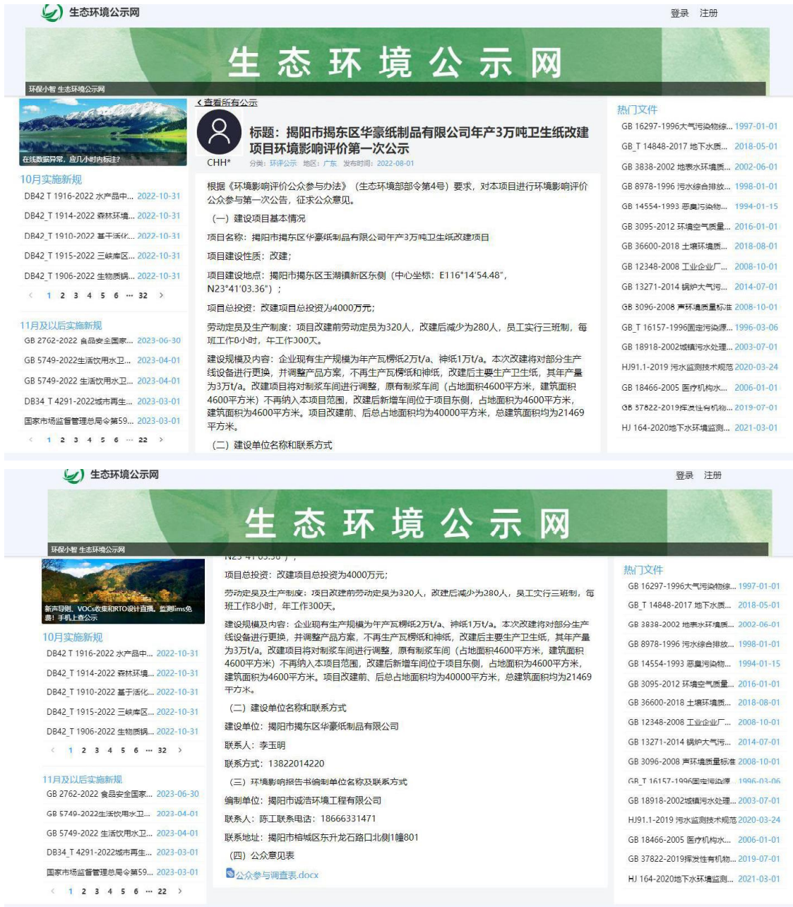
图 2-1 首次环境影响评价信息公开网络公示截图