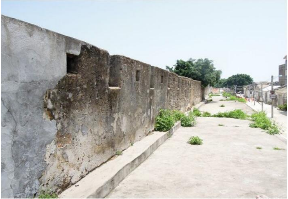
北 M 段城墙垛墙及跑马道修缮前