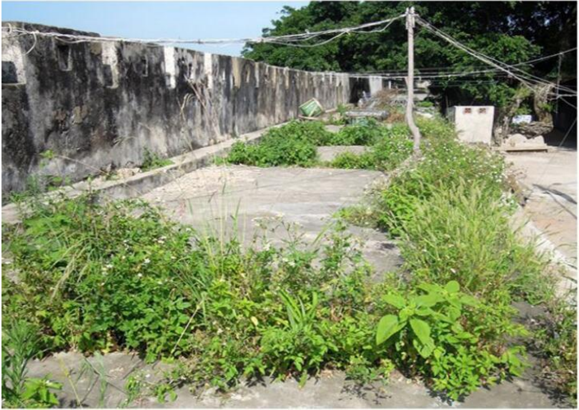
东 J 段城墙垛墙及跑马道修缮前