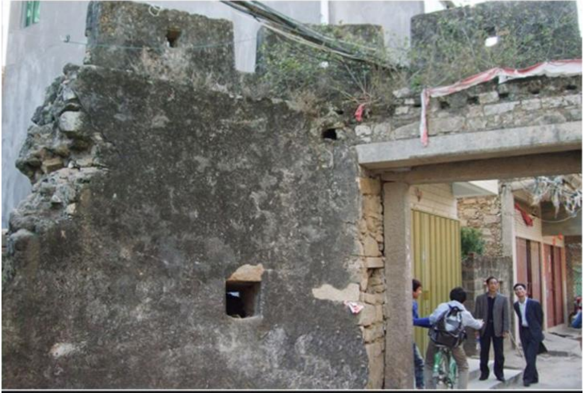
西遗址段（西瓮城）修缮前