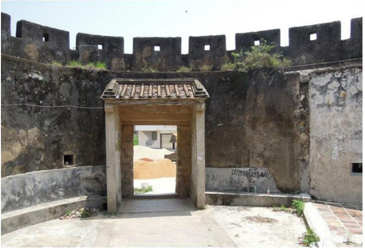
东 E 段东城门三合土墙体修缮前