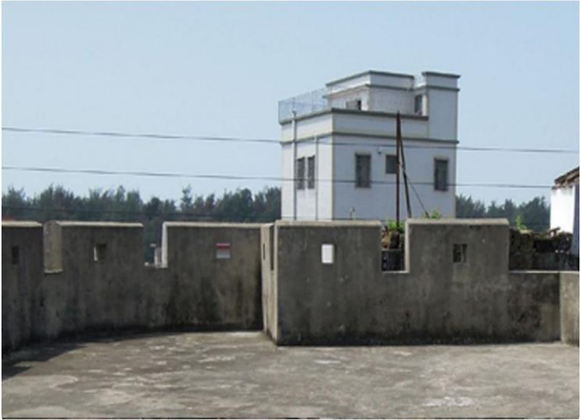
东 A 段城墙三合土墙垛修缮前