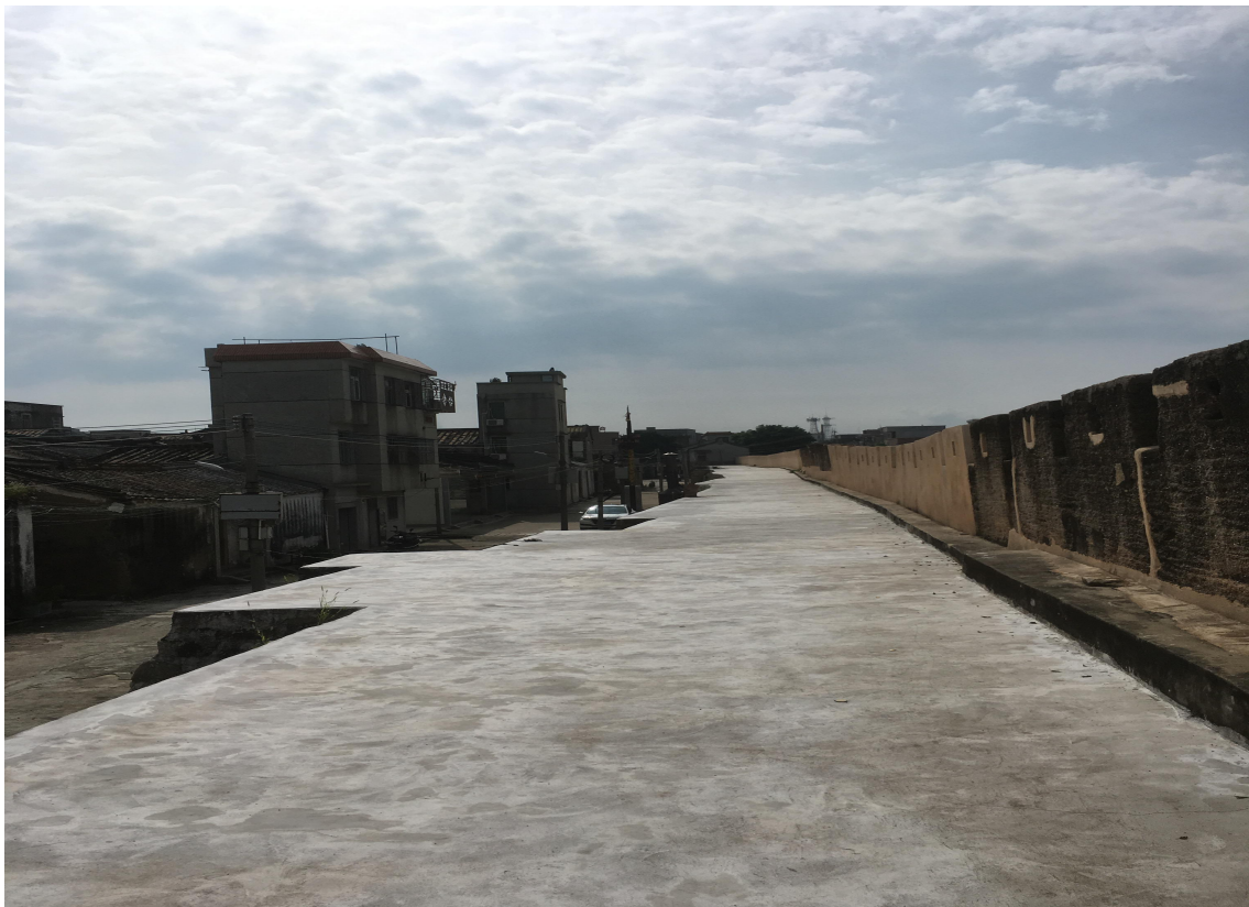
北 L 段城墙垛墙及跑马道修缮后