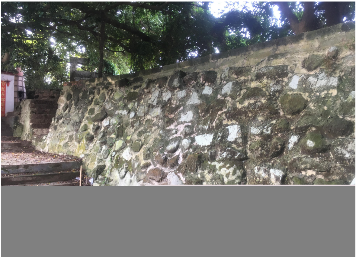
西北遗址花岗岩石墙（虎皮石墙）修缮后