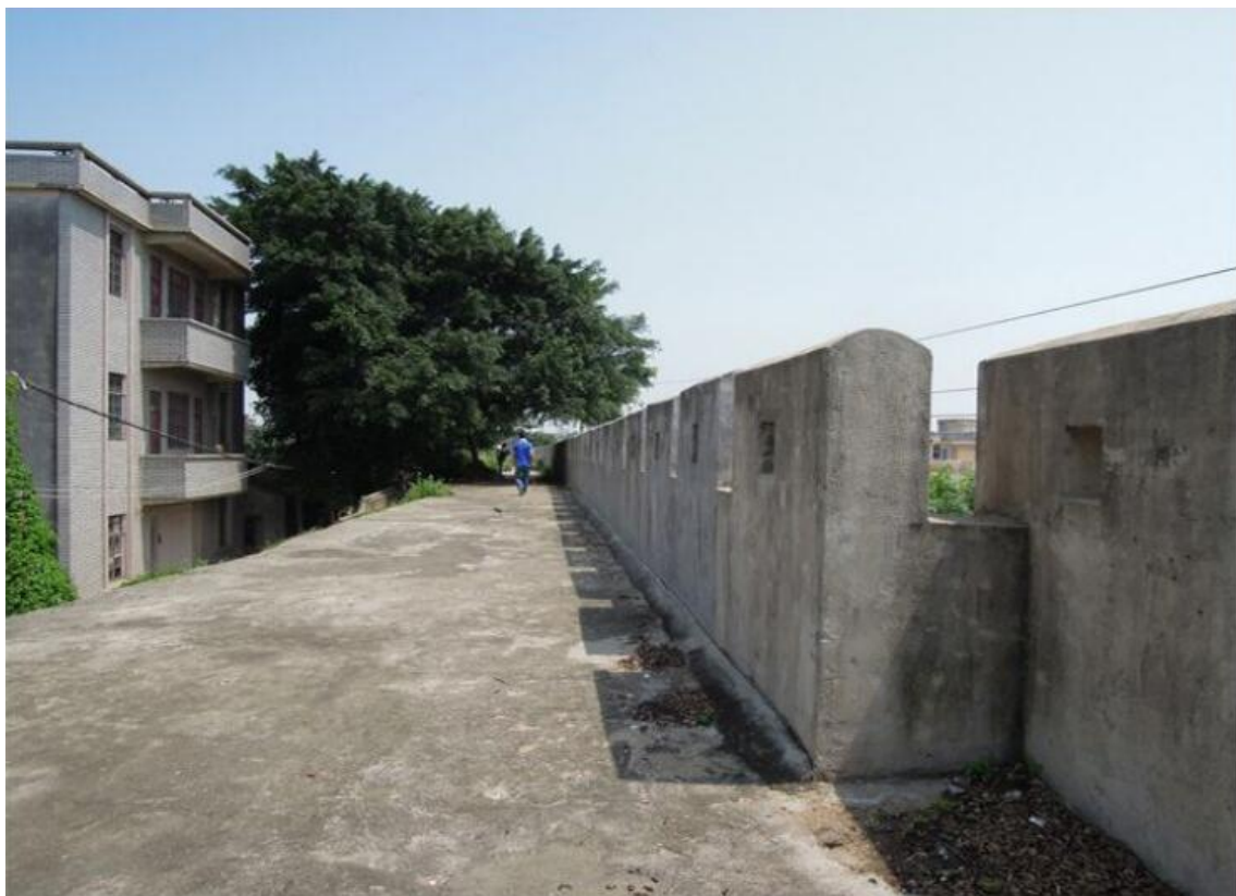
东 A 段城墙垛墙及跑马道修缮前