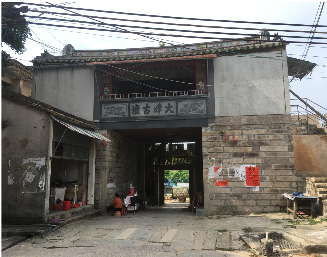
北 Q 段北城门修缮后