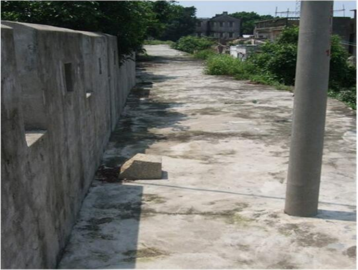
东 B 段城墙垛墙及跑马道修缮前