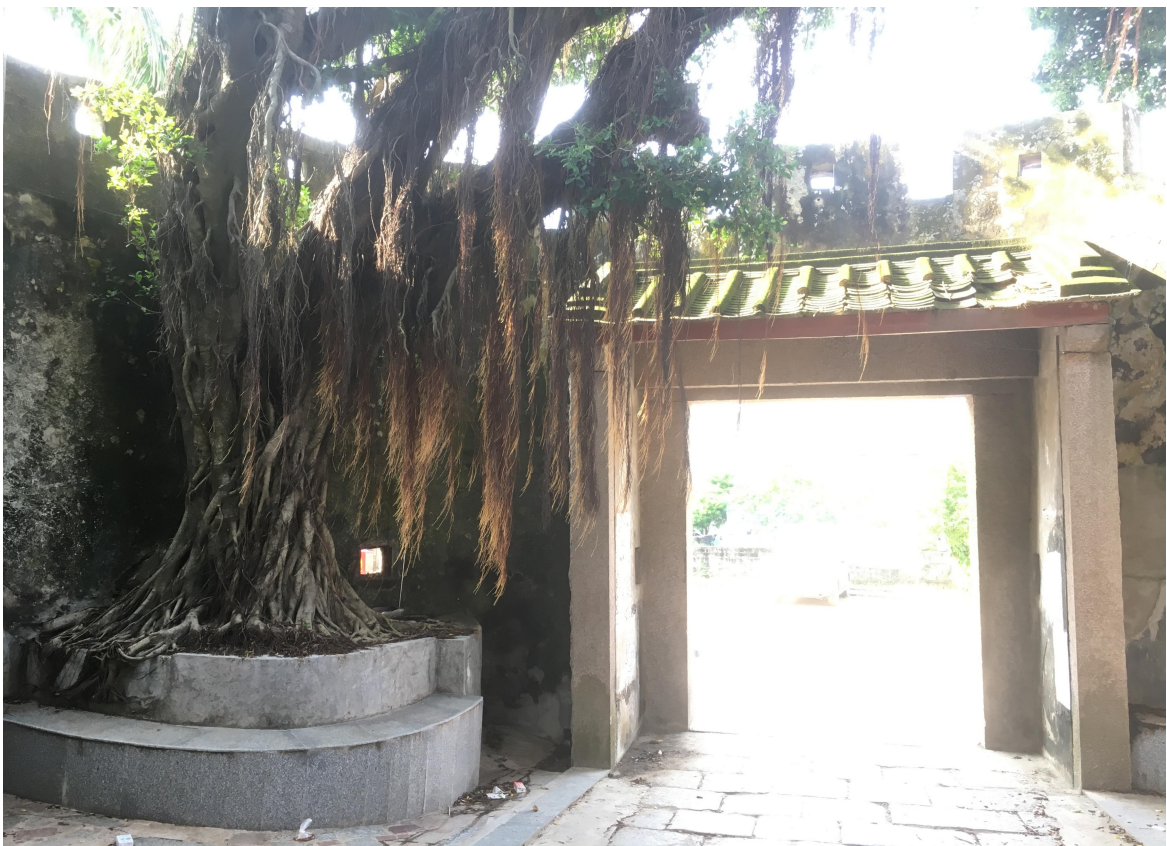
北 Q 段城墙瓮城三合土墙体修缮后