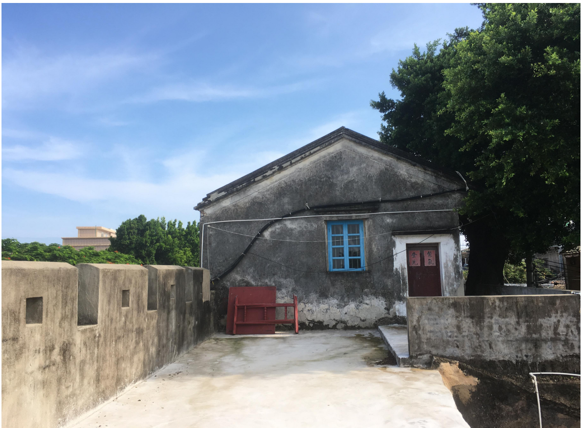
东 E 段东城门三合土墙、三合土地面修缮后