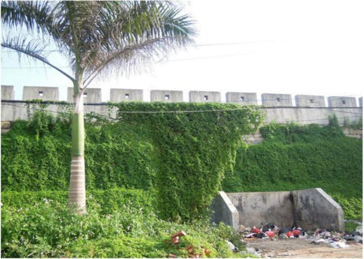
北 N 段城墙东城门三合土墙体、花岗岩石墙（虎皮石墙）修缮前