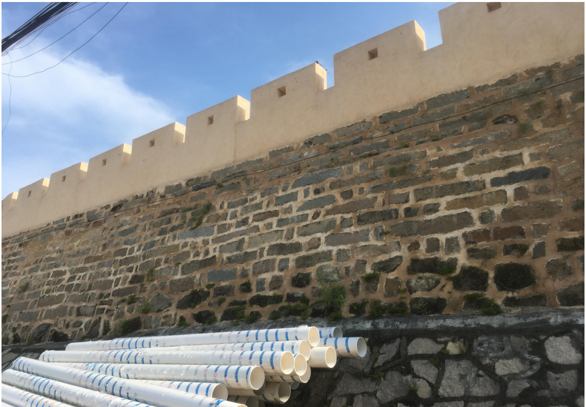
北 N 段城墙东城门三合土墙体、花岗岩石墙（虎皮石墙）修缮后