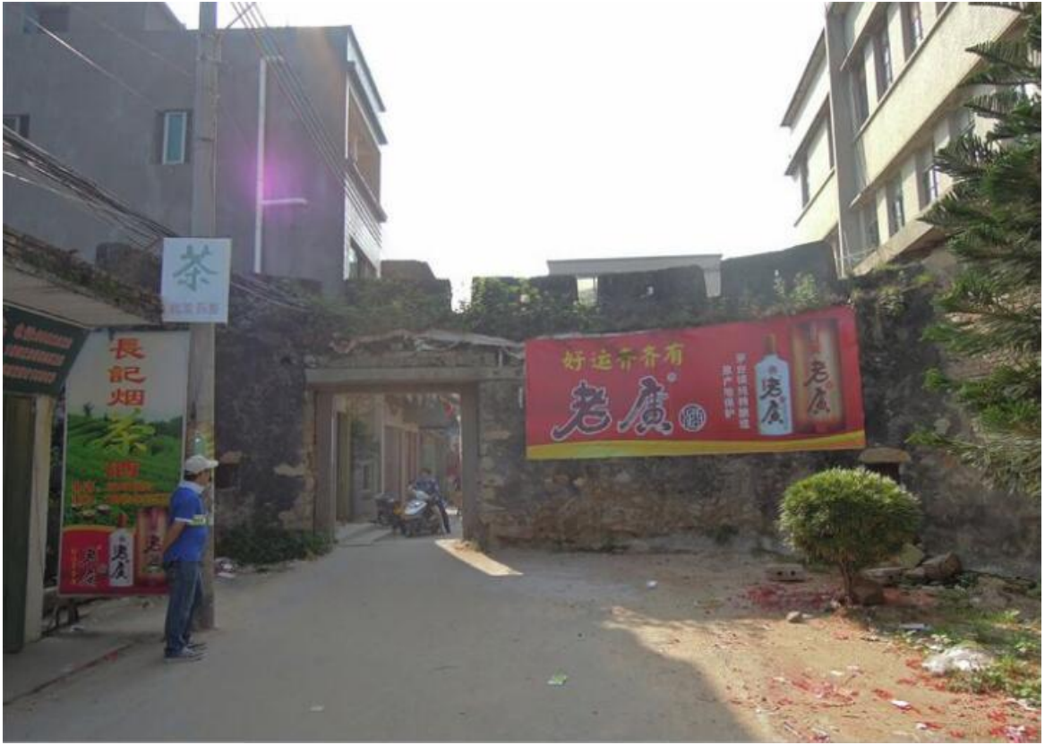
西遗址段（西窑城）修缮前