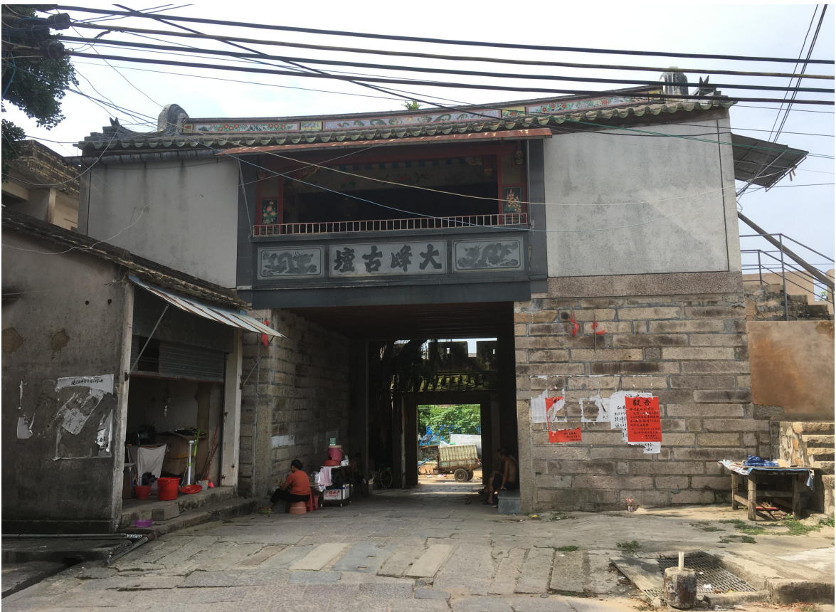
北 Q 段北城门修缮后