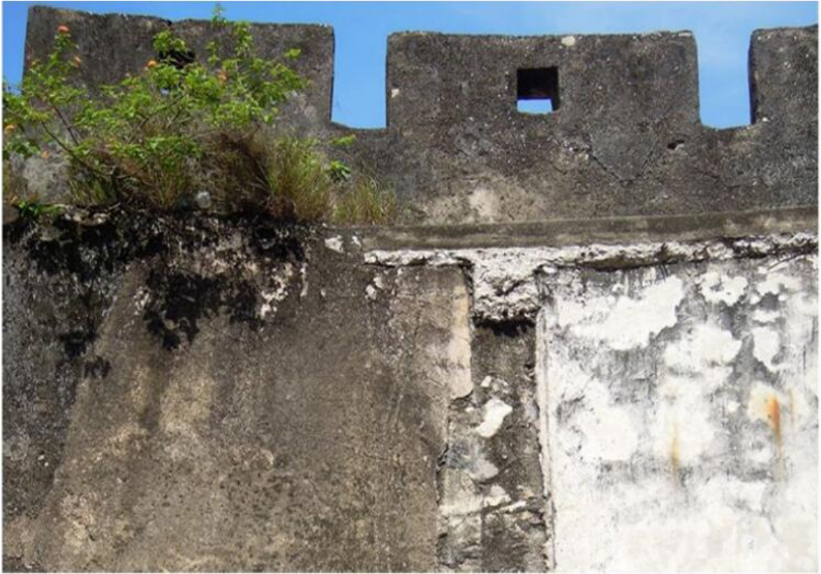
东 E 段城墙瓮城三合土墙体修缮前