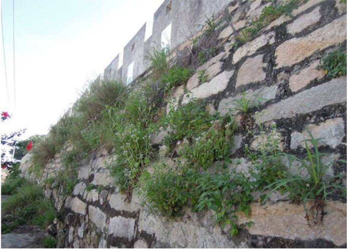
东 A 段城墙花岗岩石墙（虎皮石墙）修缮前