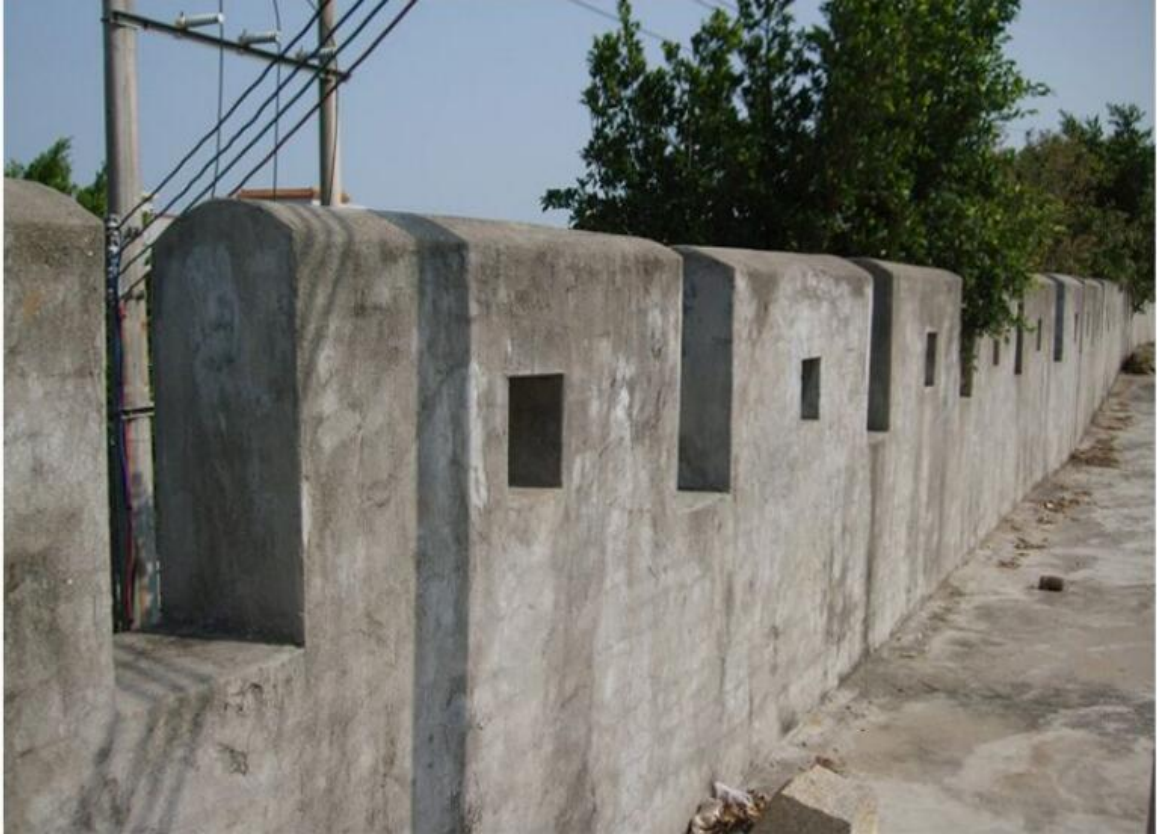
东 B 段城墙三合土墙垛修缮前