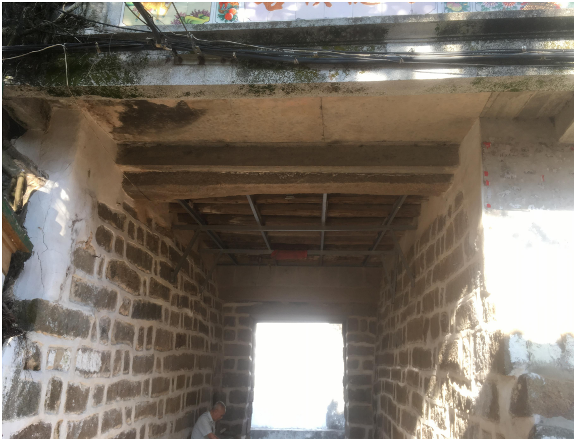
东 E 段东城门花岗岩石墙（虎皮石墙）修缮后