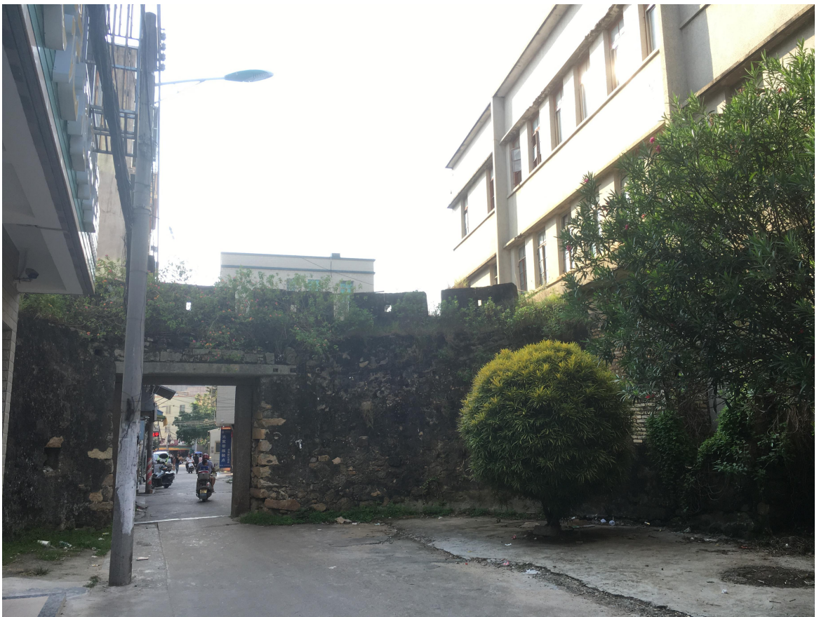
西遗址段（西窑城）修缮后