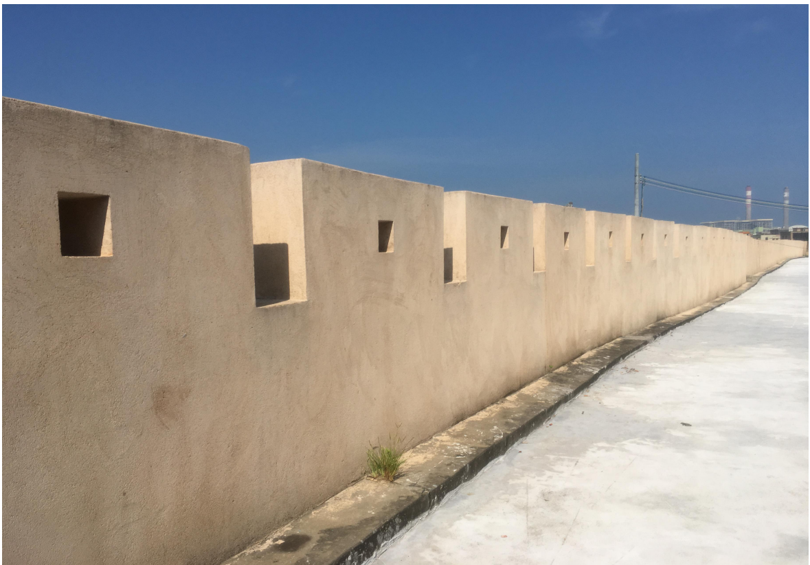
北 N 段城牆三合土牆垛修繕后