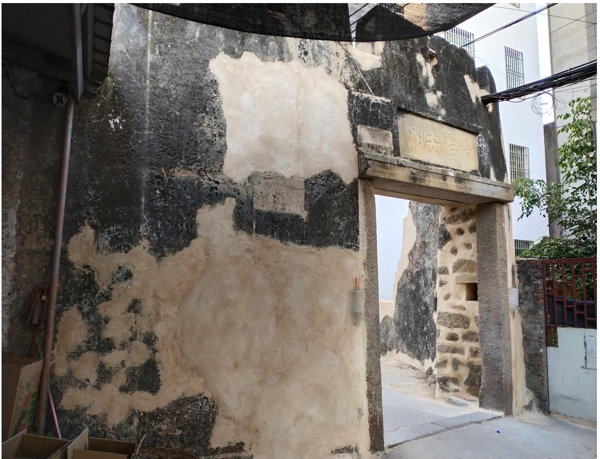
西遗址段（西瓮城）修缮后