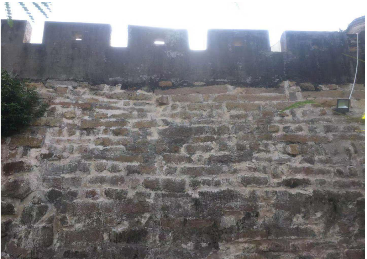
东 D 段城墙花岗岩石墙（虎皮石墙）修缮后