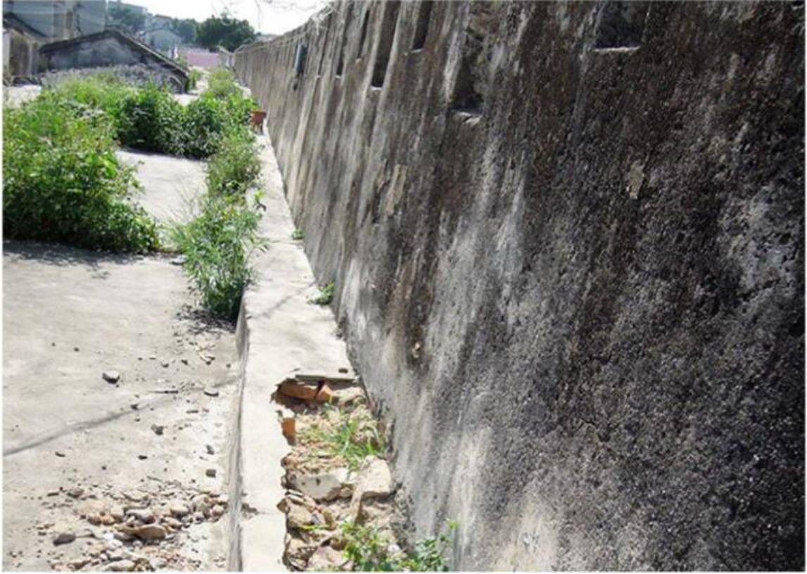
北 K 段城墙垛墙及跑马道修缮前