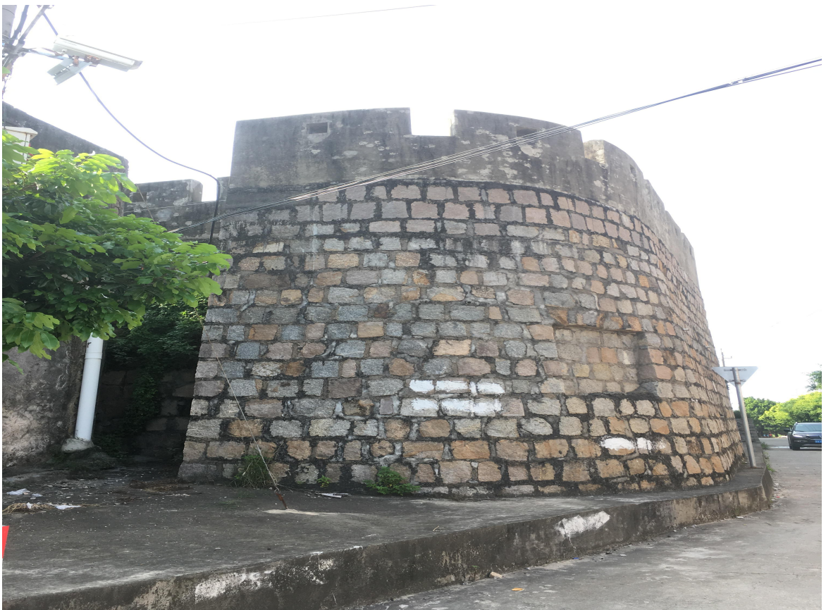
东 A 段东北角楼花岗岩石墙（虎皮石墙）修缮后