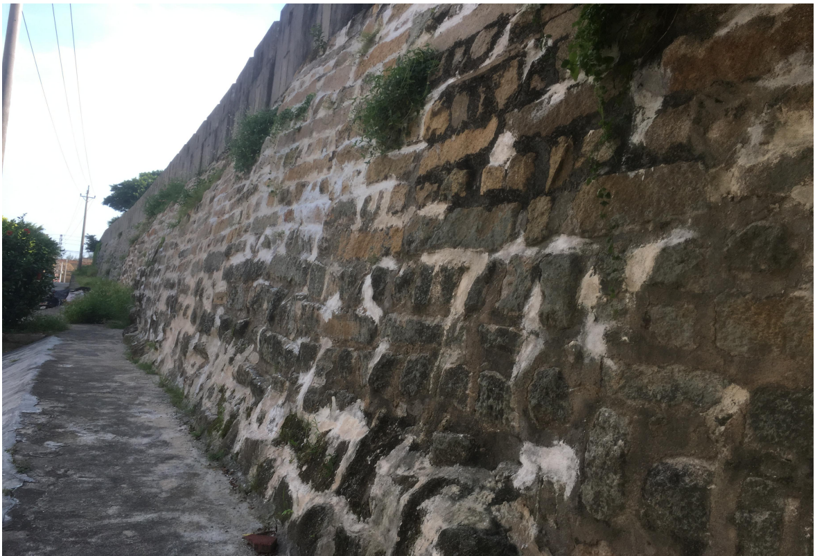
东 A 段城墙花岗岩石墙（虎皮石墙）修缮后