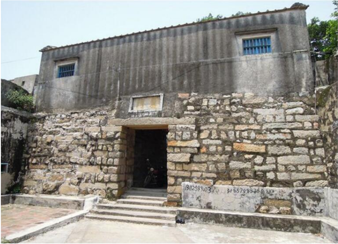
东 E 段城墙东城门三合土墙体、花岗岩石墙（虎皮石墙）修缮前