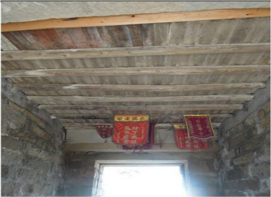
东 E 段东城门花岗岩石墙（虎皮石墙）修缮前