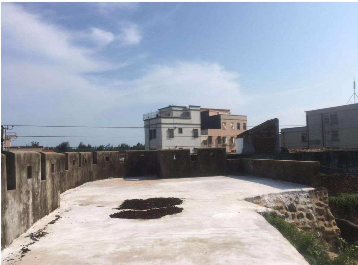
东 A 段东北角楼三合土墙、三合土地面修缮后