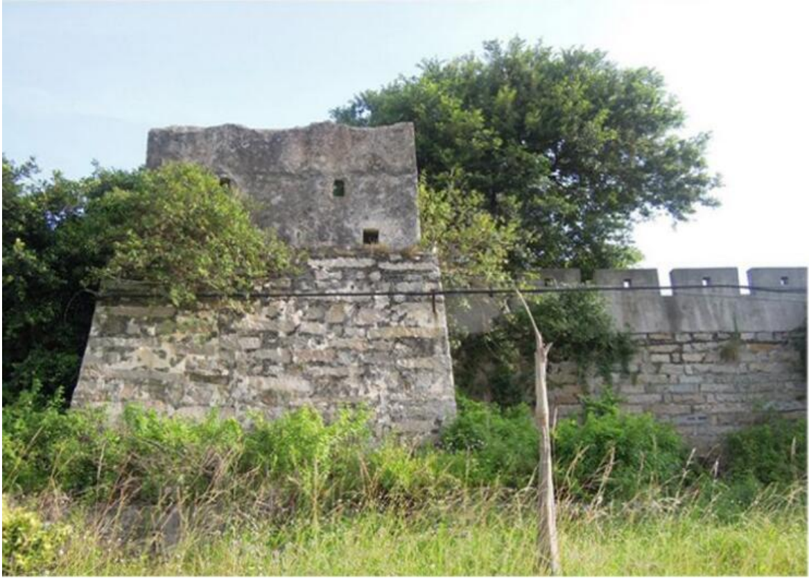
东 G 段城墙花岗岩石墙（虎皮石墙）修缮前