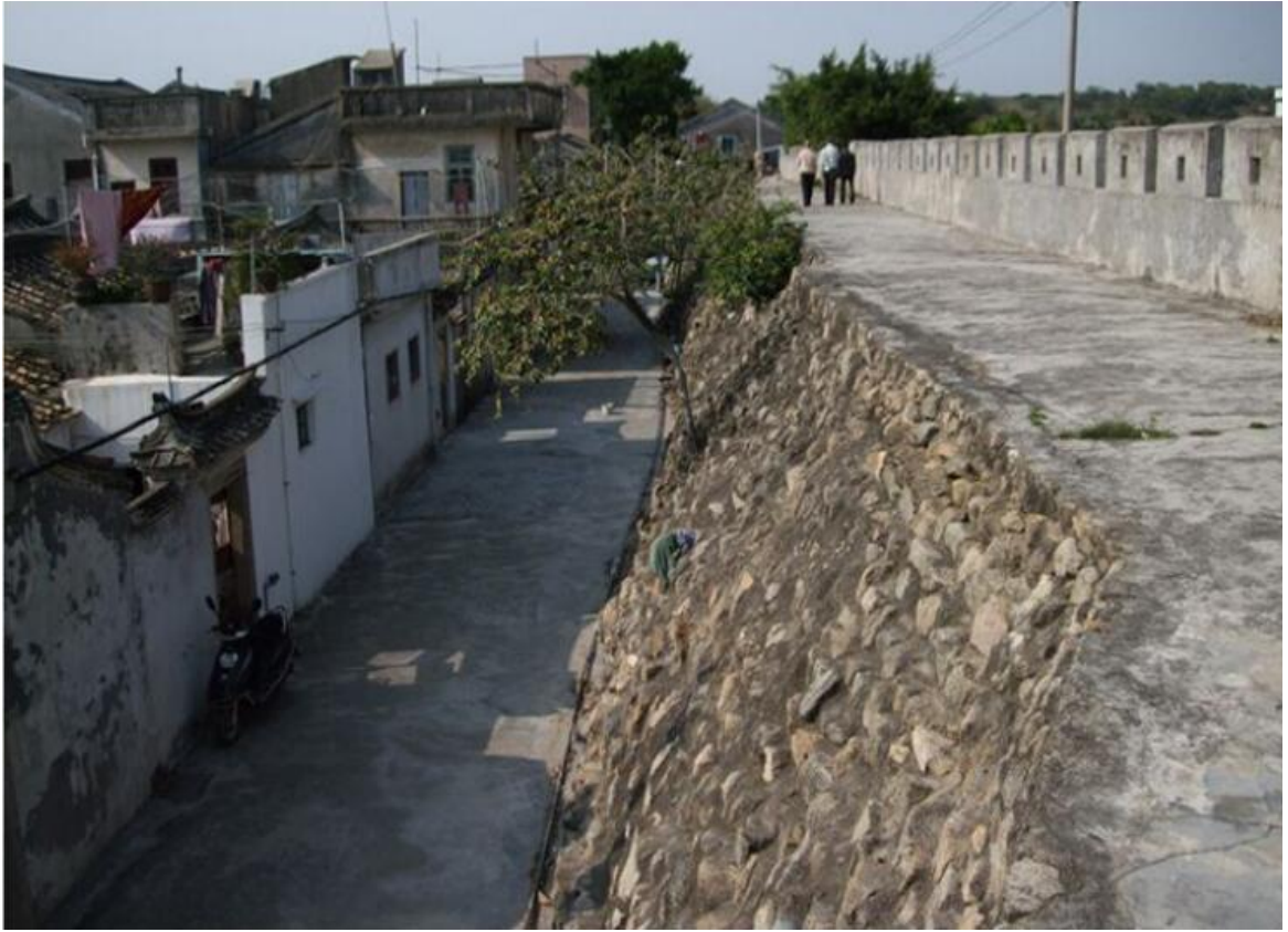
东 D 段城墙垛墙及跑马道修缮前