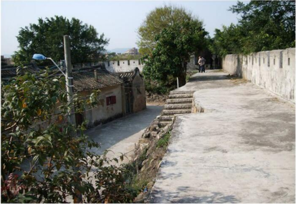
东 F 段城墙垛墙及跑马道修缮前