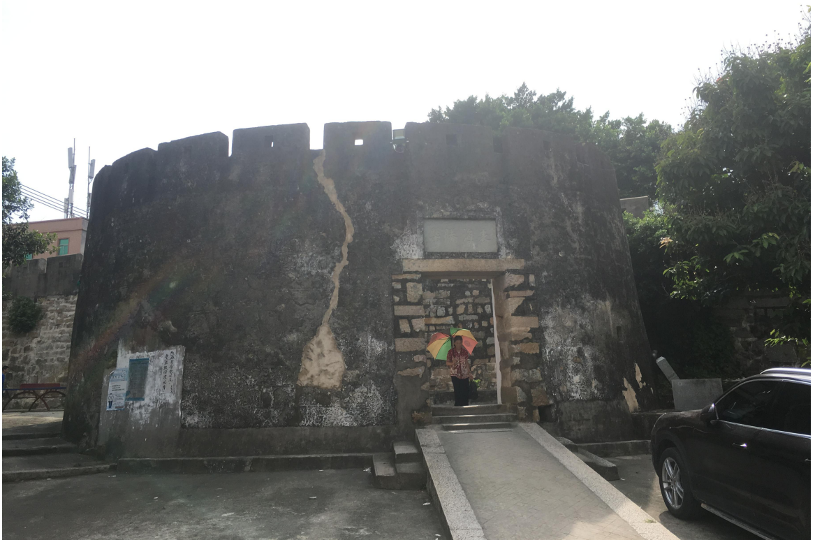
东 E 段城墙三合土墙体修缮后