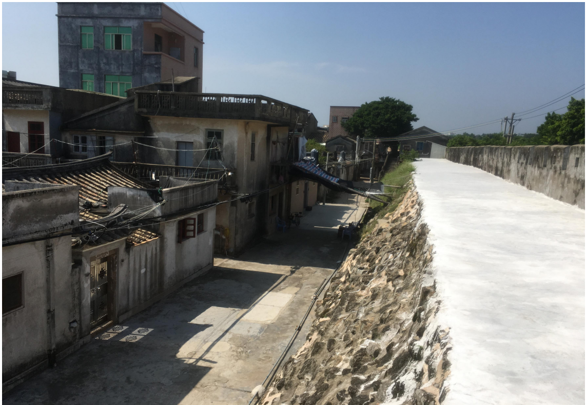
东 D 段城墙垛墙及跑马道修缮后