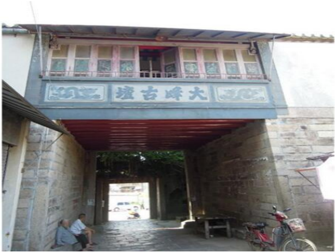
北 Q 段北城门修缮前