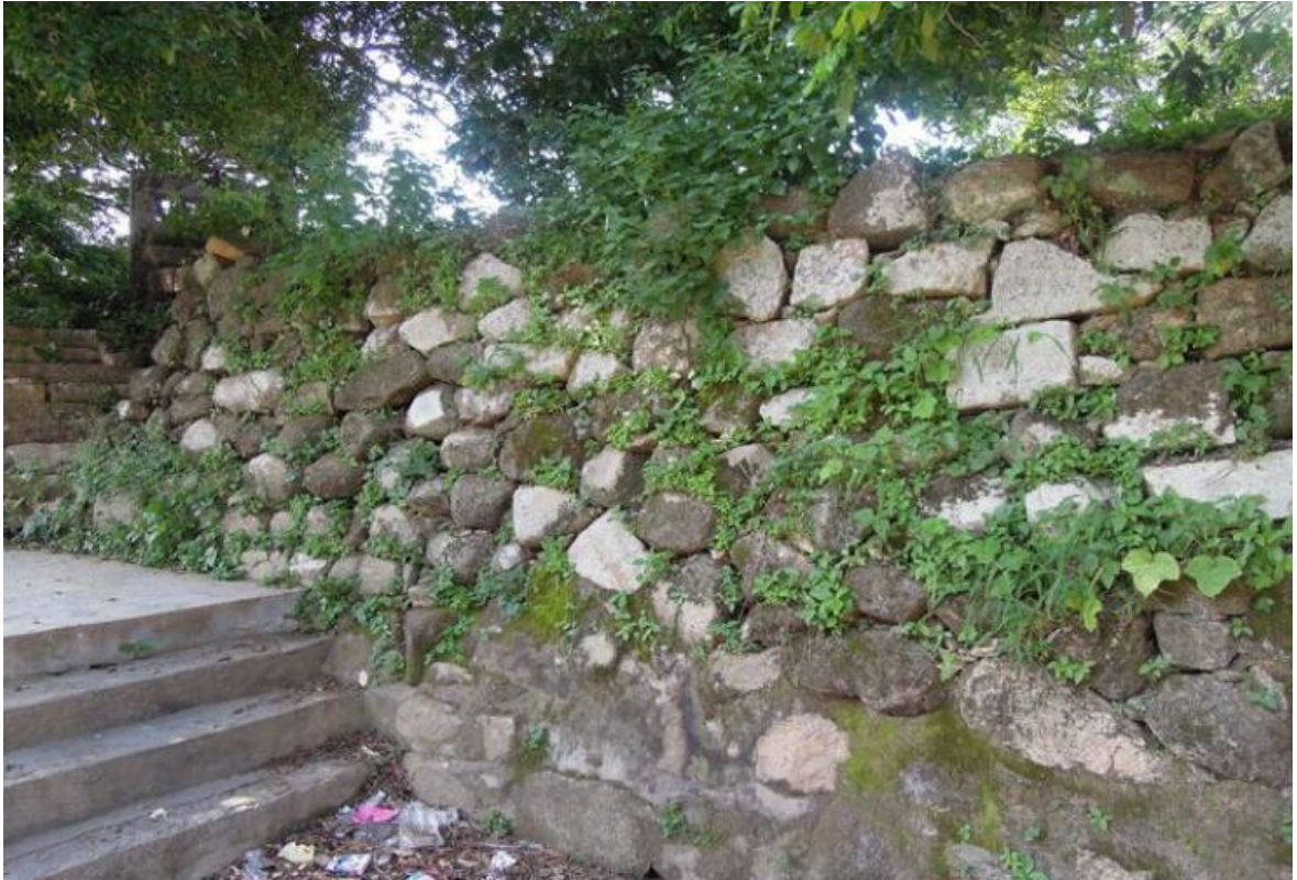
西北遗址花岗岩石墙（虎皮石墙）修缮前