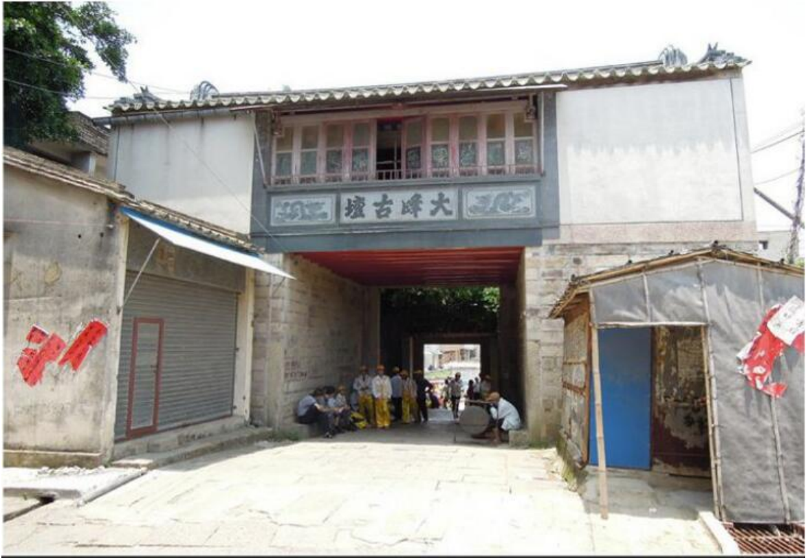
北 Q 段北城门修缮前