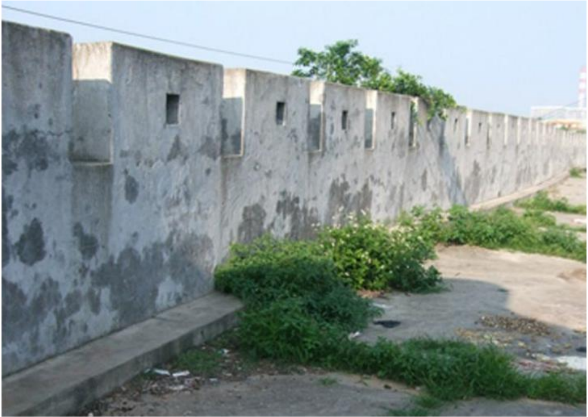
北 N 段城牆三合土牆垛修繕前