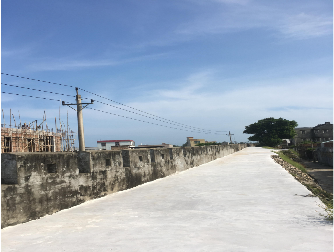
东 C 段城墙三合土墙垛修缮前