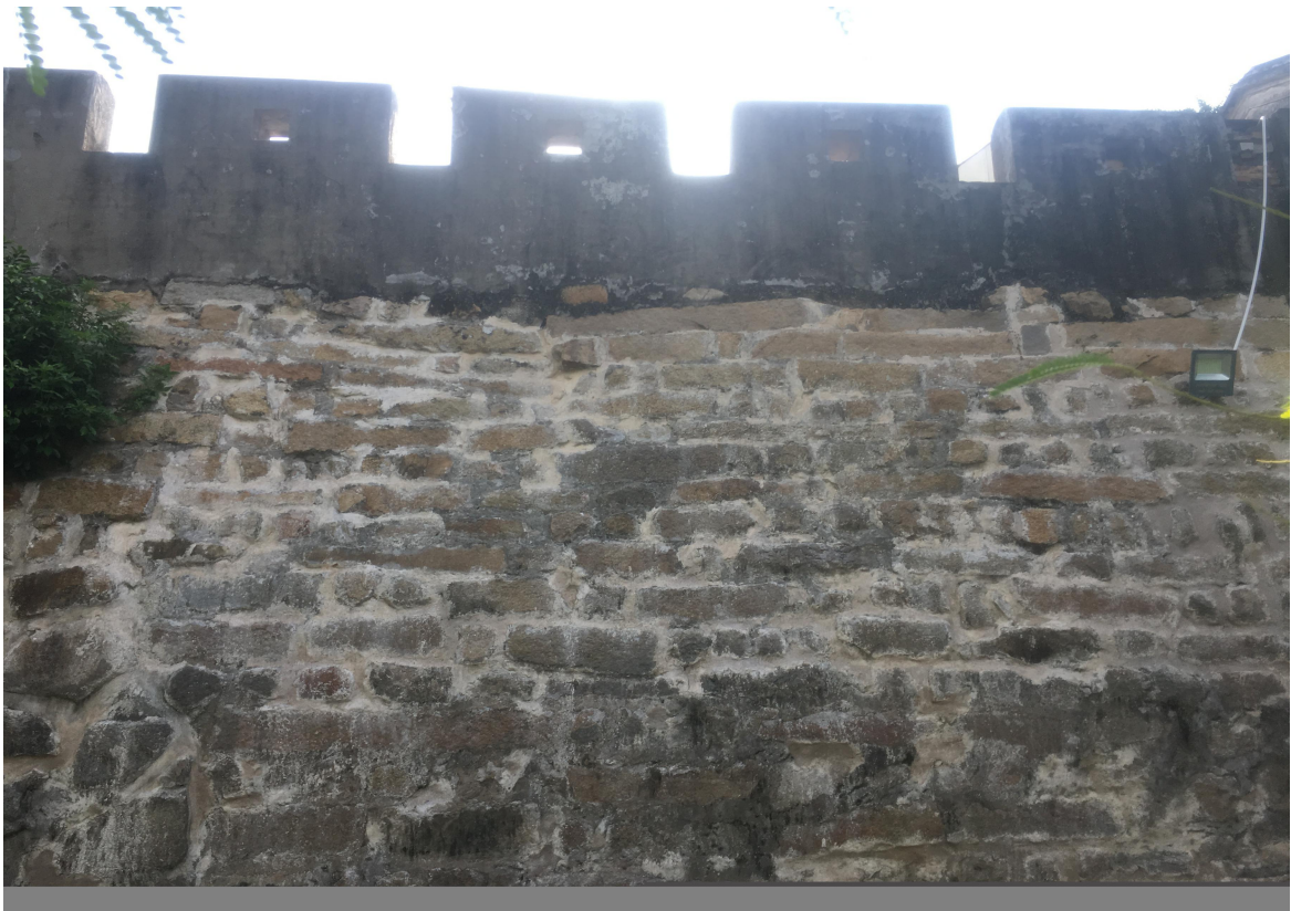
北 M 段城墙花岗岩石墙（虎皮石墙）修缮后