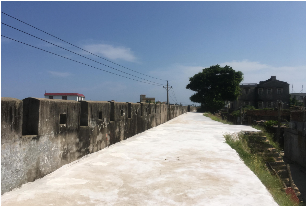
东 C 段城墙垛墙及跑马道修缮后