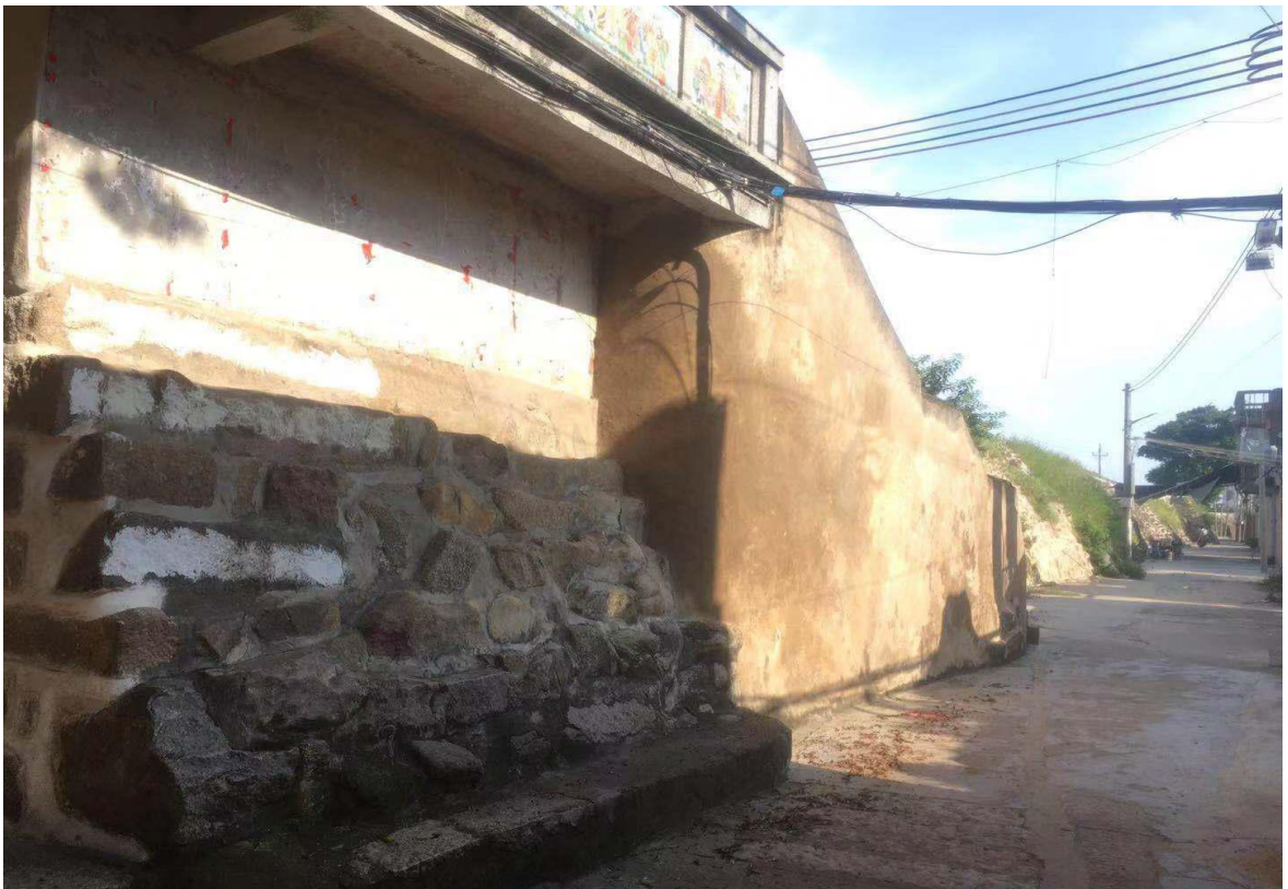
东 E 段城墙东城门三合土墙体、花岗岩石墙（虎皮石墙）修缮后