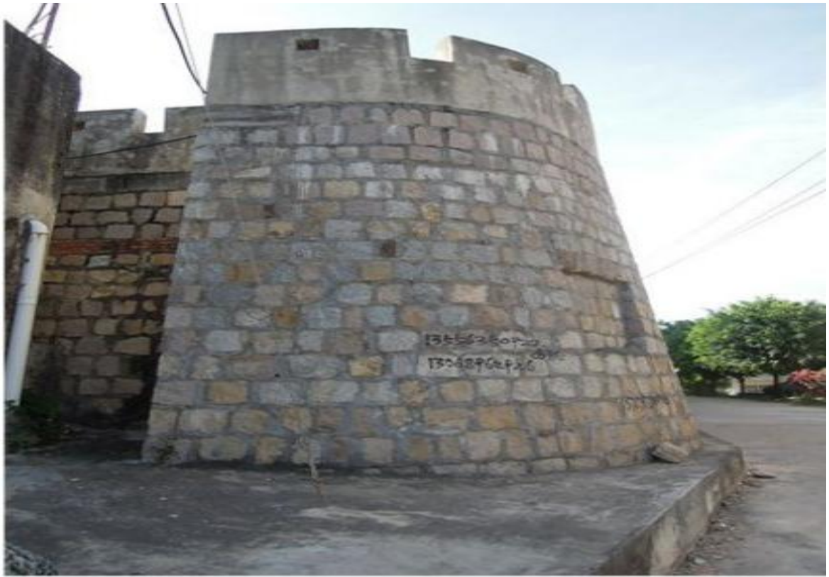
东 A 段东北角楼花岗岩石墙（虎皮石墙）修缮前