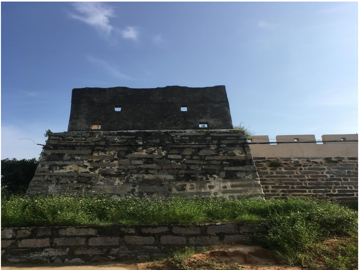
东 G 段城墙花岗岩石墙（虎皮石墙）修缮后