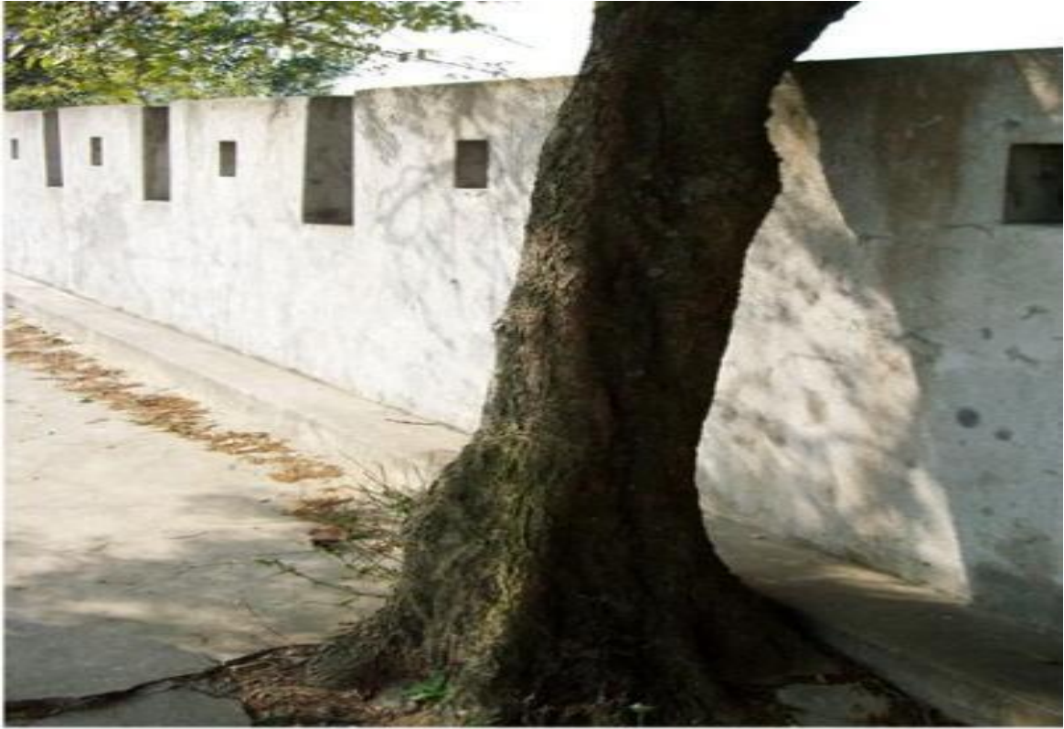
东 H 段城墙垛墙及跑马道修缮前