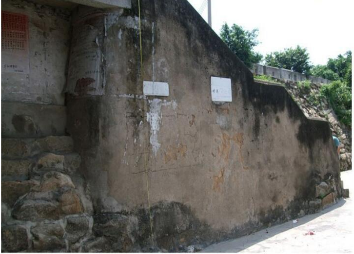
东 E 段城墙东城门三合土墙体、花岗岩石墙（虎皮石墙）修缮前