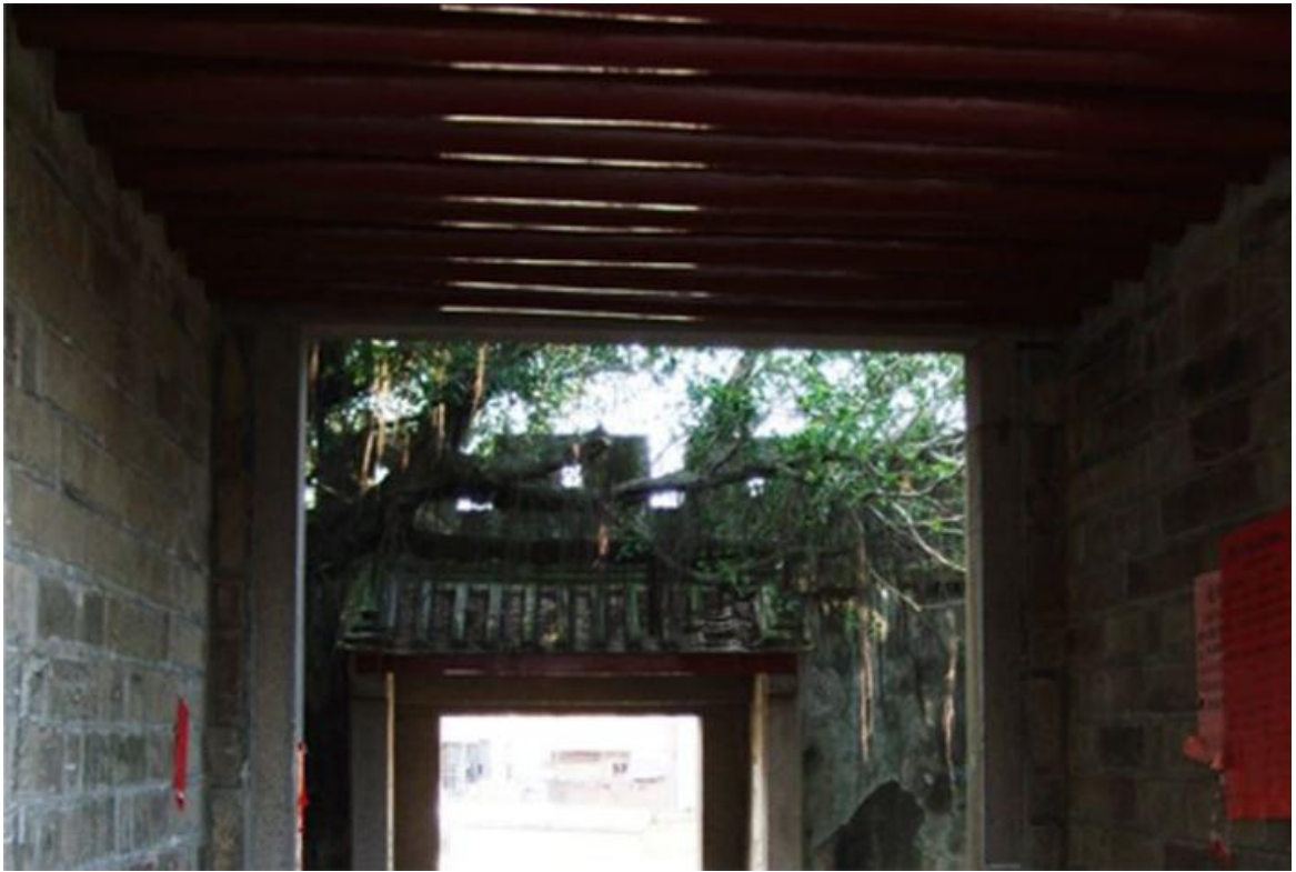
北 Q 段北城门修缮前