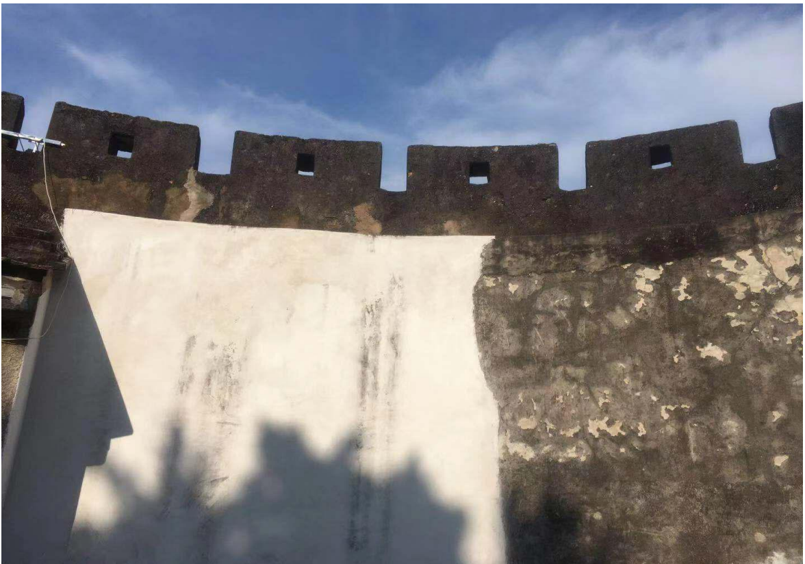
东 E 段城墙瓮城三合土墙体修缮后