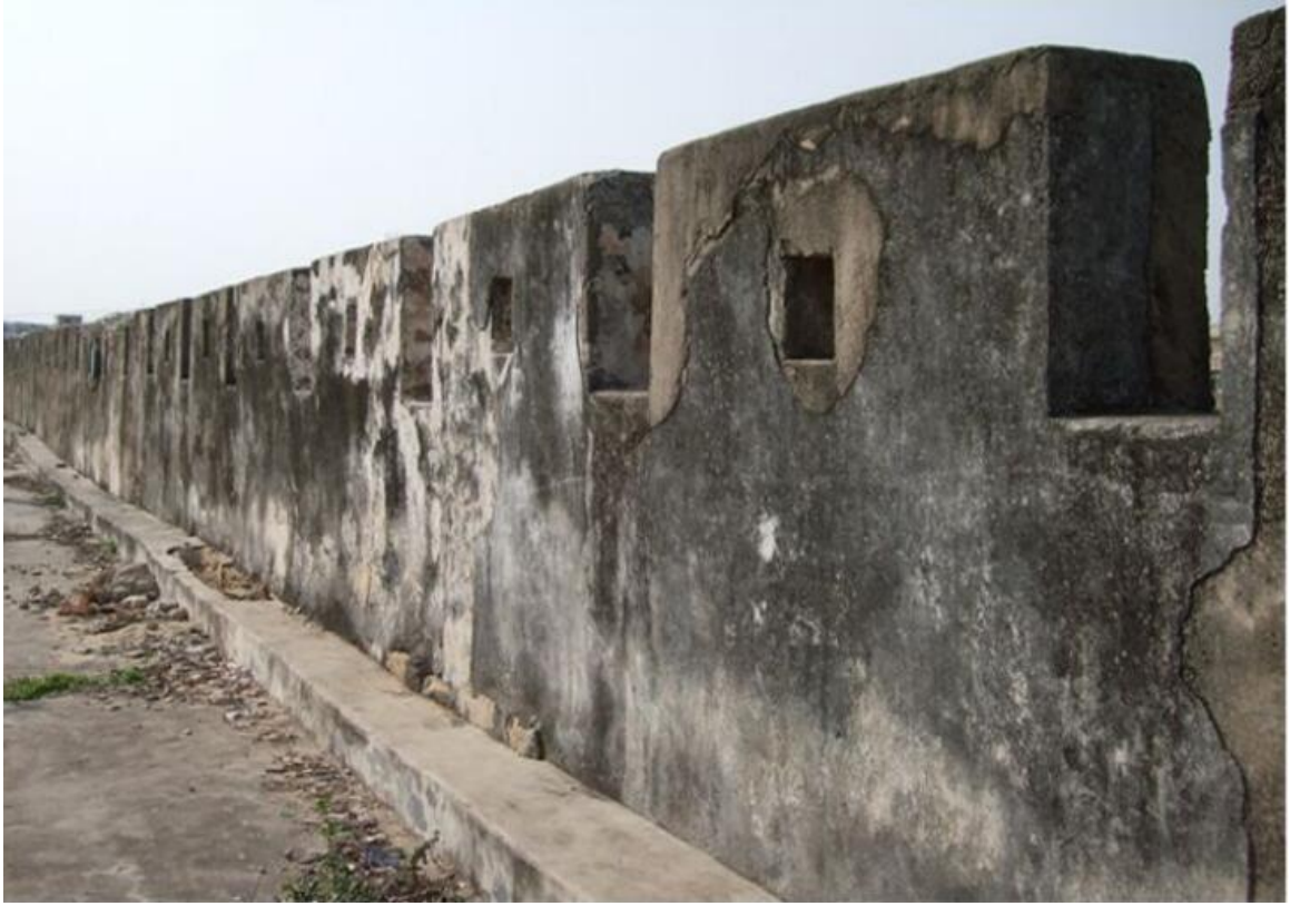
北 K 段城墙三合土墙垛修缮前