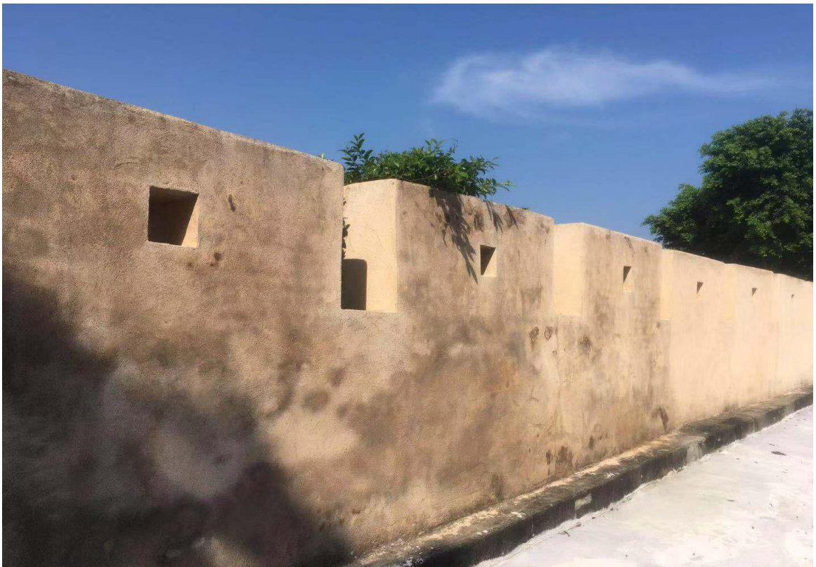
北J段城墙三合土墙垛修缮后