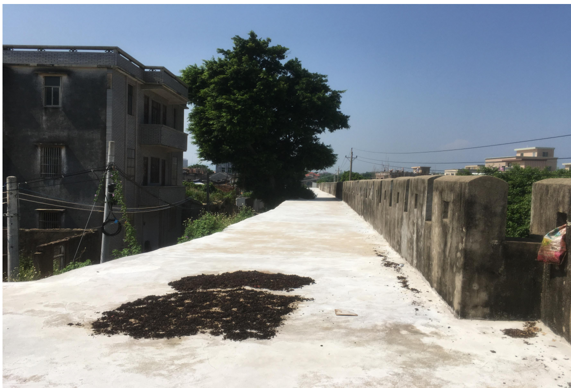
东 A 段城墙垛墙及跑马道修缮后