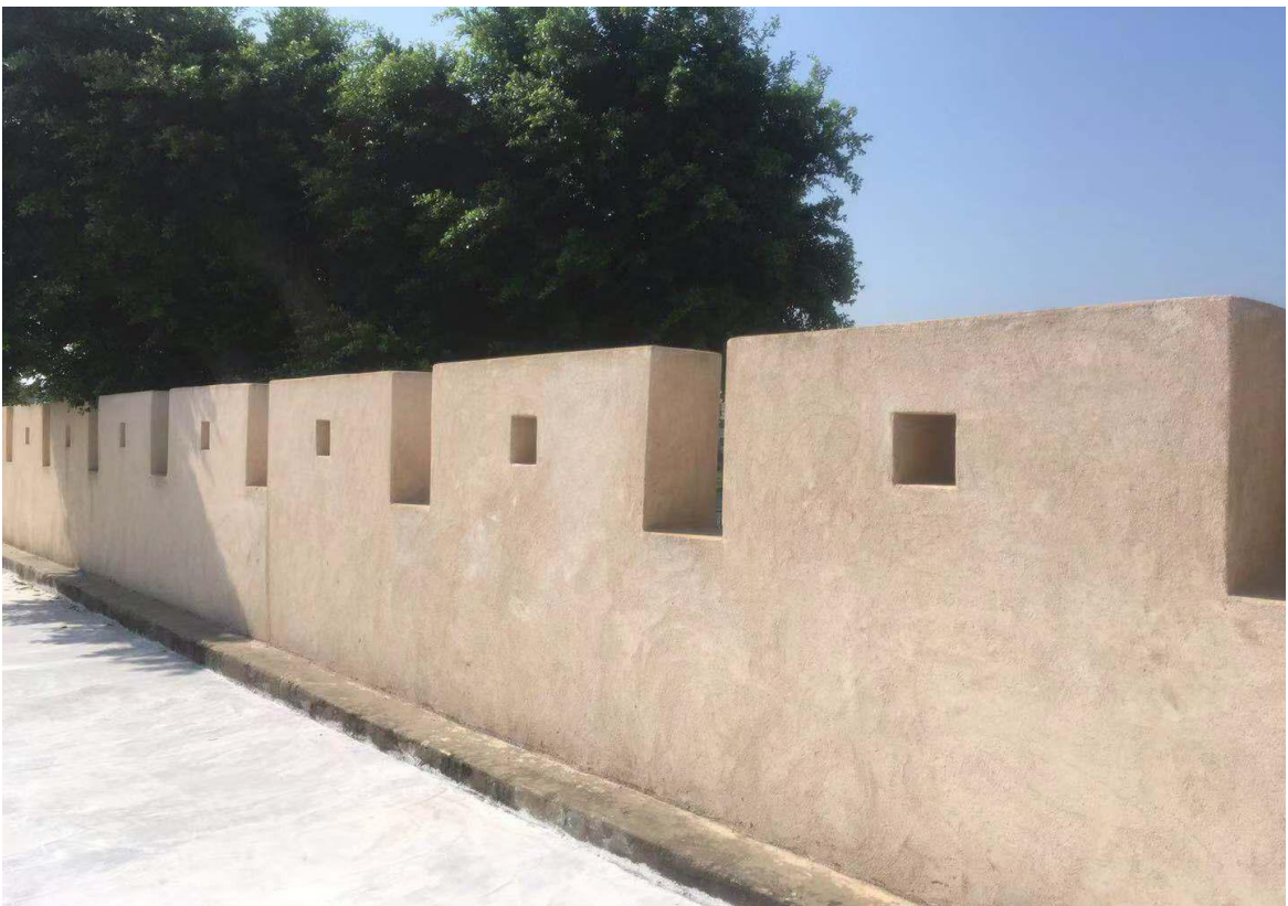
北 H 段城墙三合土墙垛修缮后