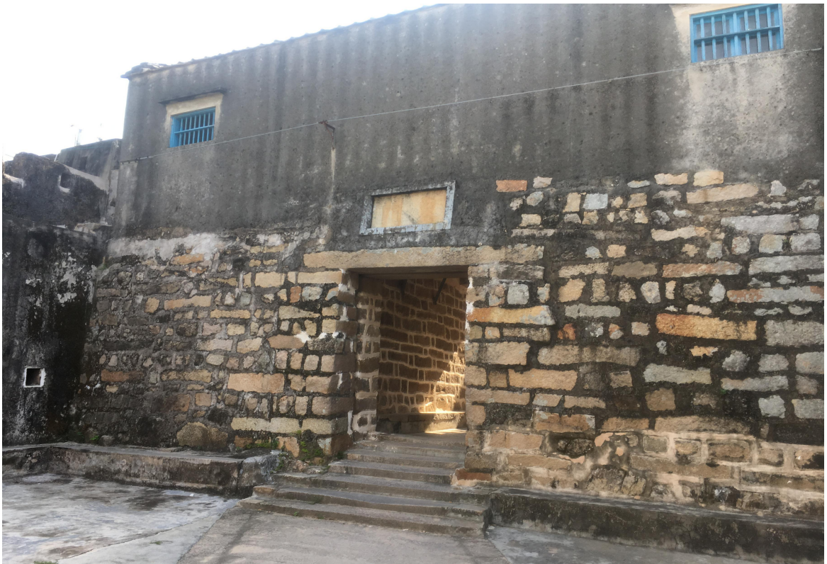
东 E 段城墙东城门三合土墙体、花岗岩石墙（虎皮石墙）修缮后