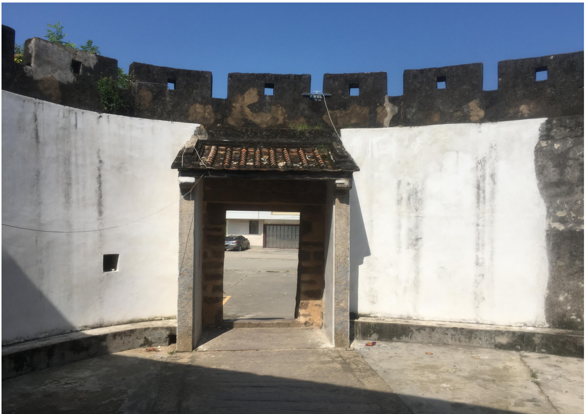
东 E 段东城门三合土墙体修缮后