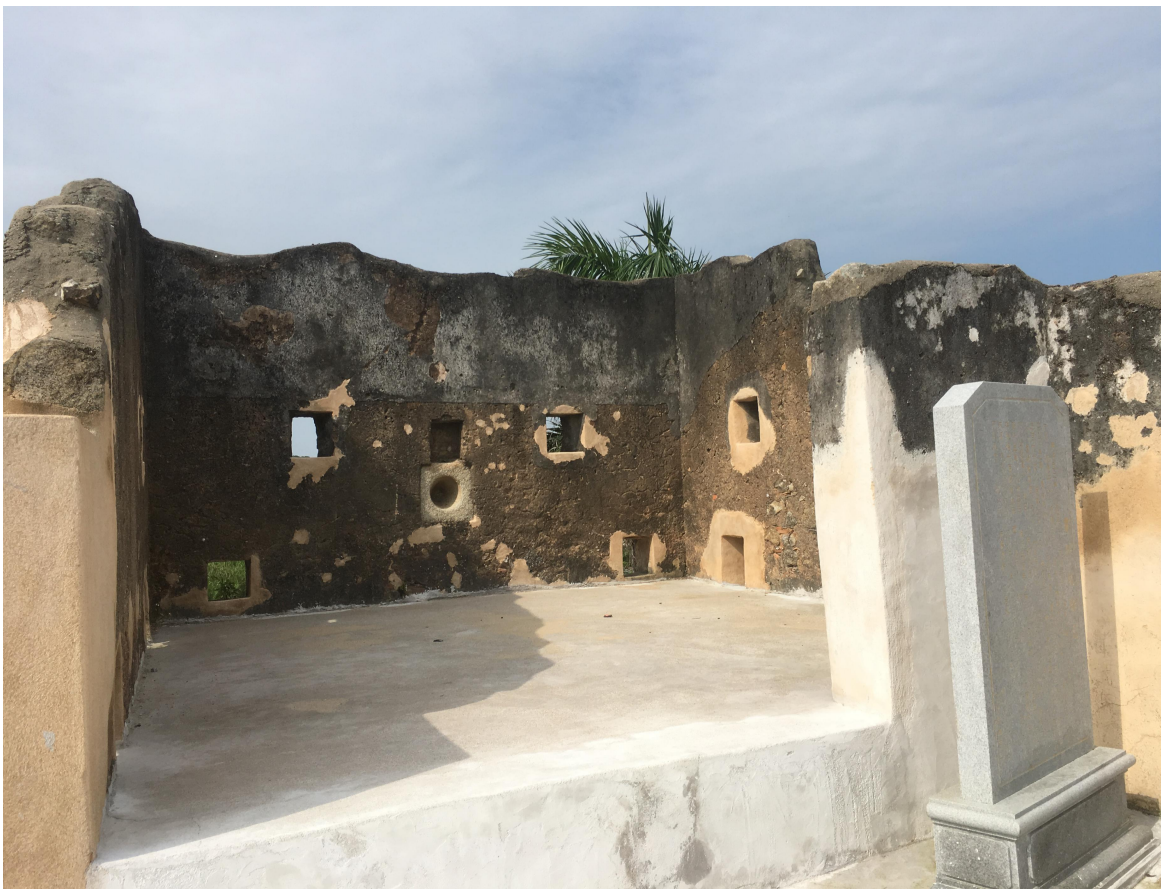
东 G 段城墙东北角楼三合土墙修缮后