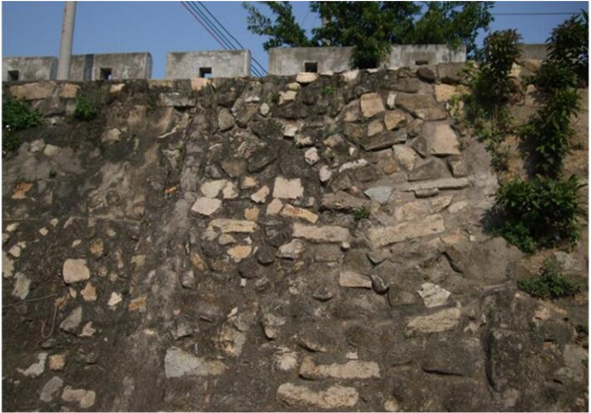
东 D 段城墙花岗岩石墙（虎皮石墙）修缮前