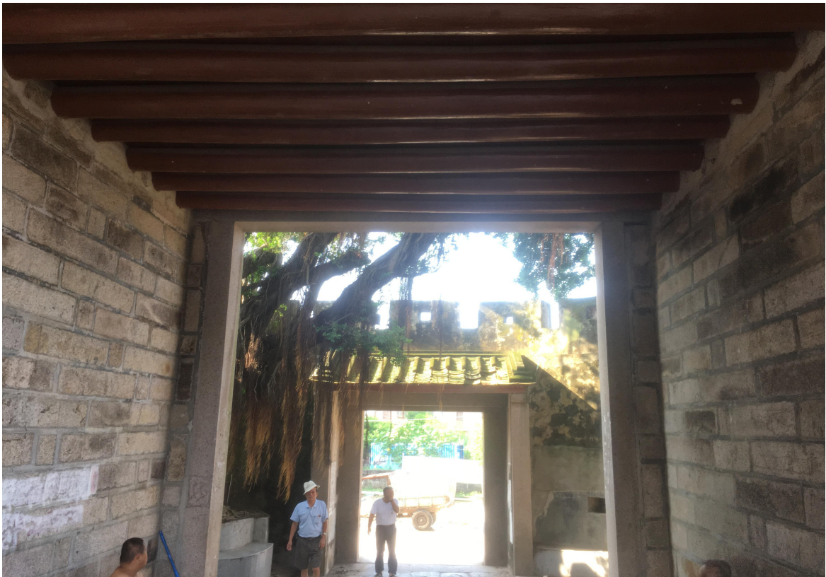
北 Q 段北城门修缮后