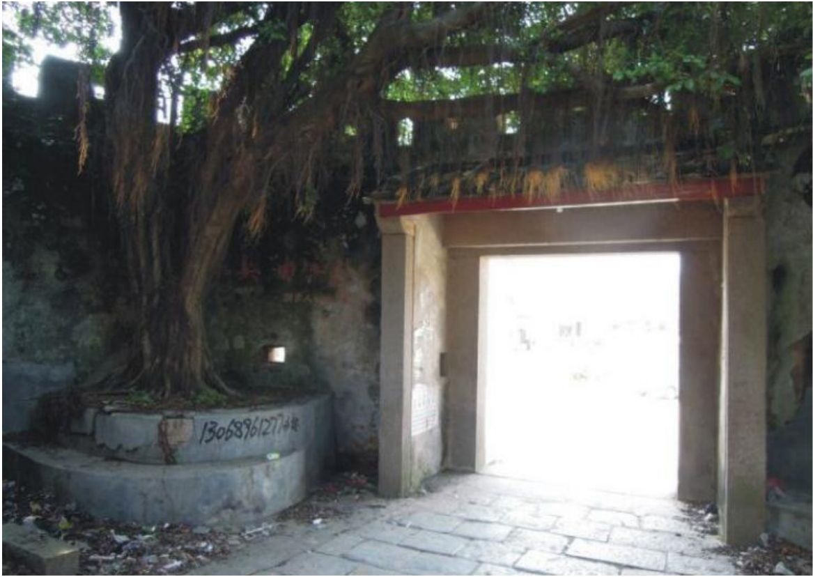
北 Q 段城墙瓮城三合土墙体修缮前