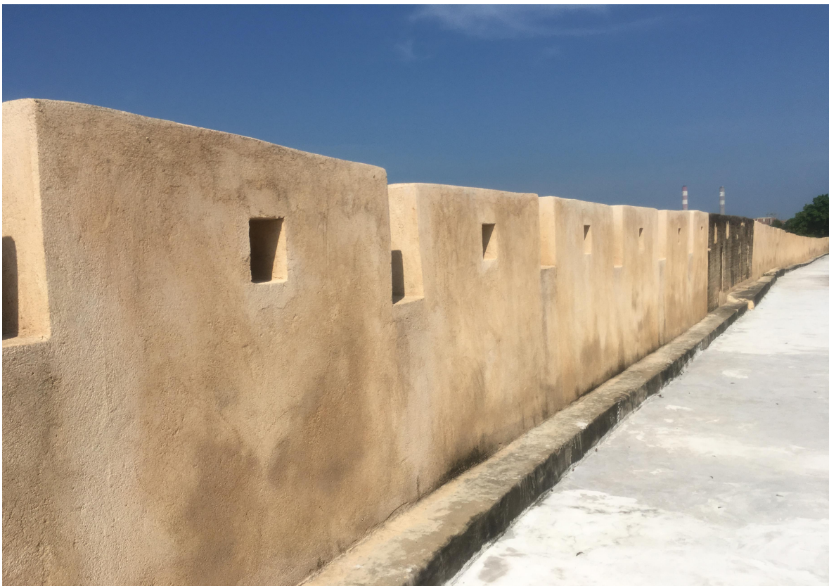
北 L 段城墙三合土墙垛修缮后