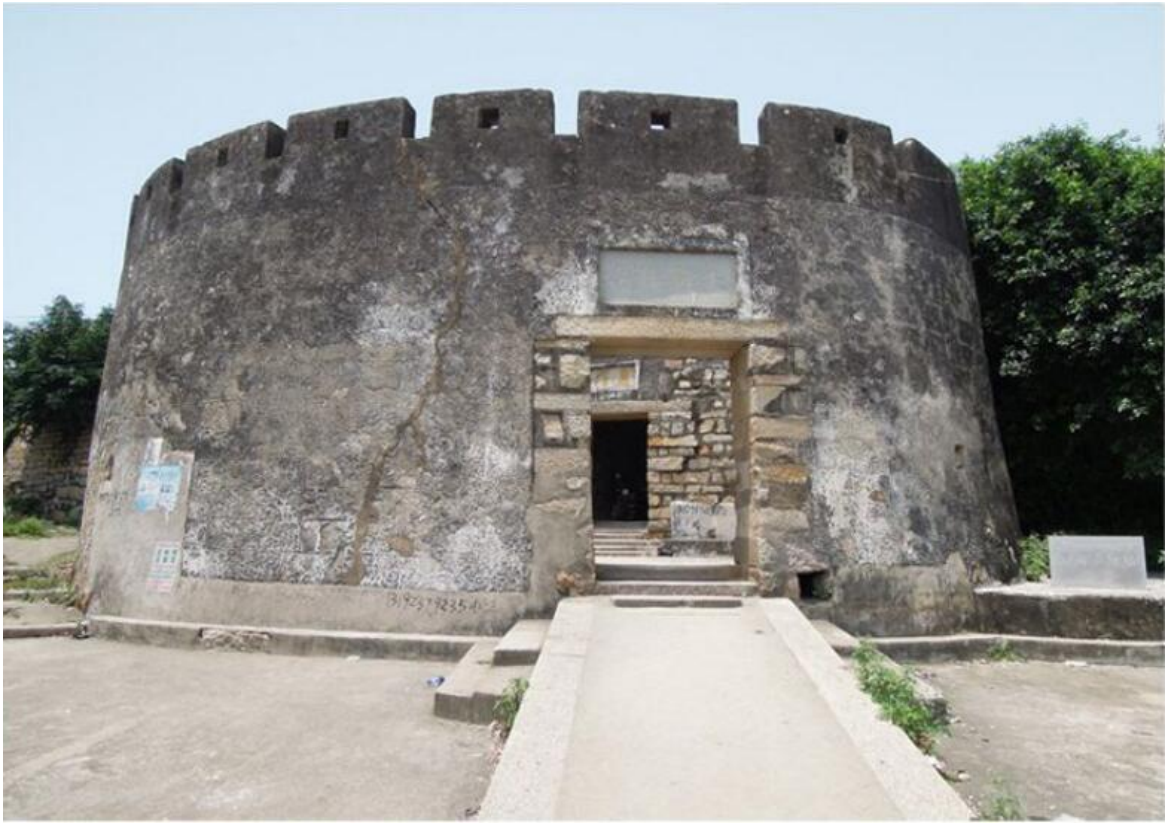
东 E 段城墙三合土墙体修缮前