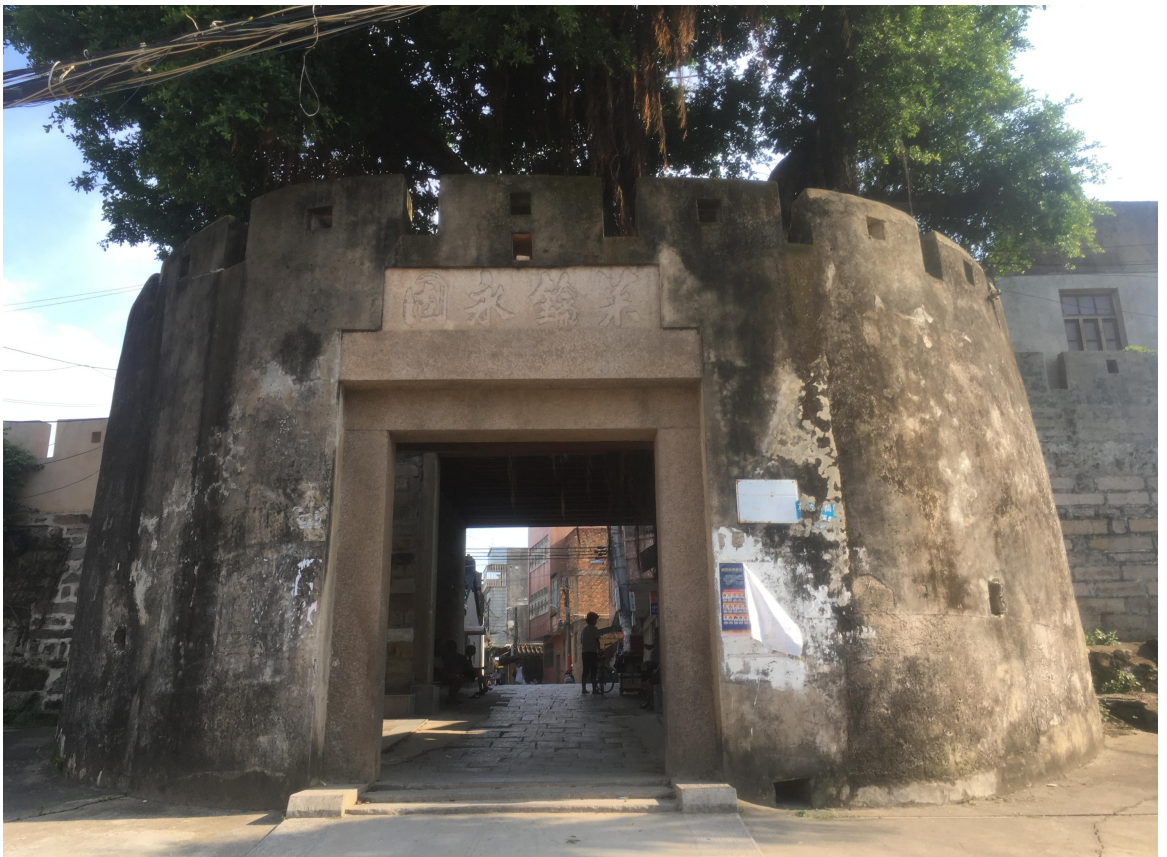
北 Q 段城墙北瓮城三合土墙体修缮后