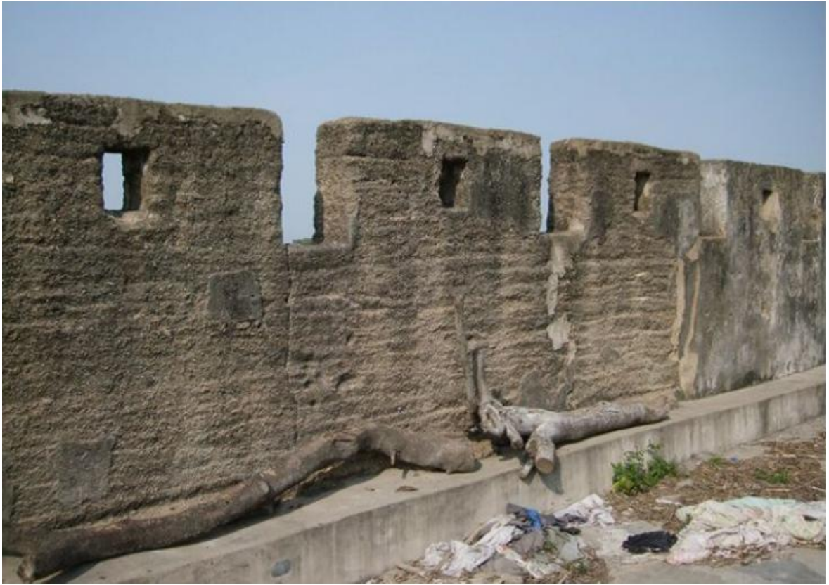
北 L 段城墙三合土墙垛修缮前