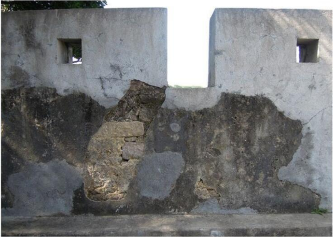
北J段城墙三合土墙垛修缮前