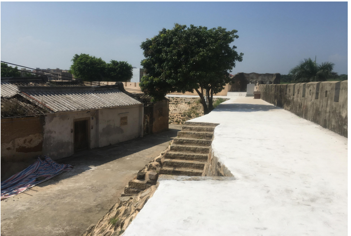
东 F 段城墙垛墙及跑马道修缮后