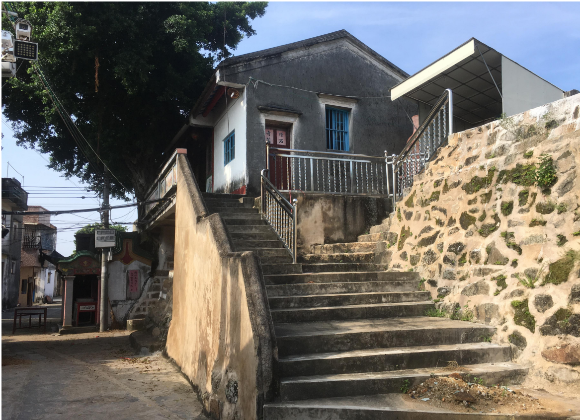
东 E 段东城门花岗岩石墙（虎皮石墙）修缮后