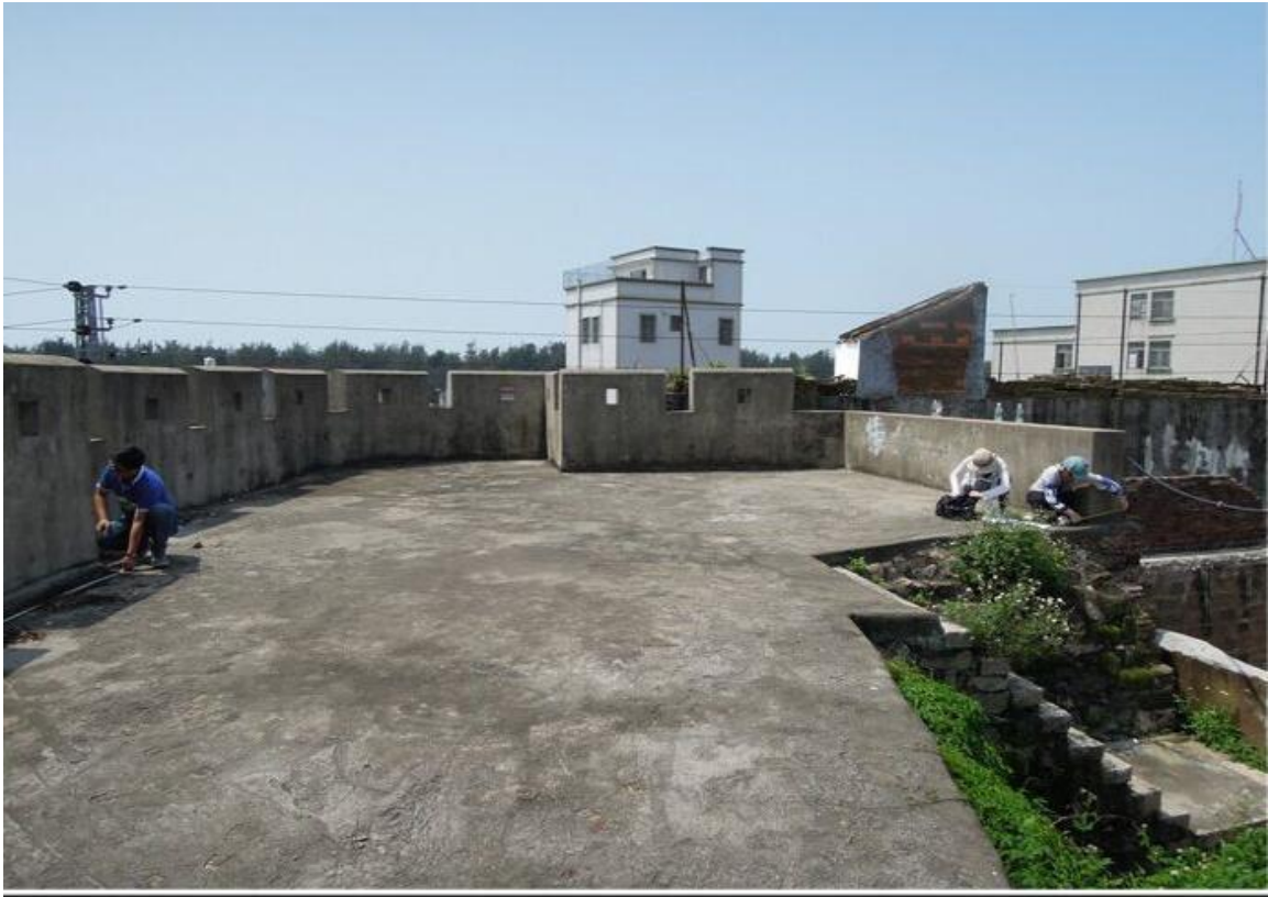
东 A 段东北角楼三合土墙、三合土地面修缮前