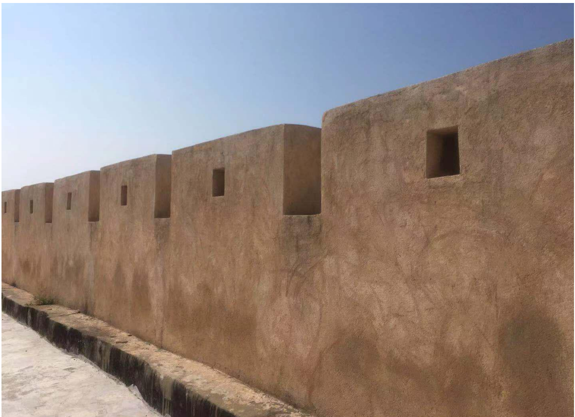
北 K 段城墙三合土墙垛修缮后