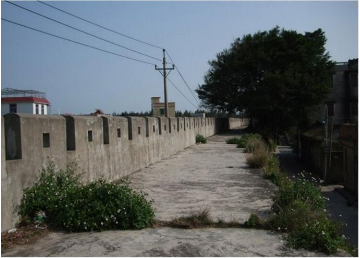
东 C 段城墙垛墙及跑马道修缮前