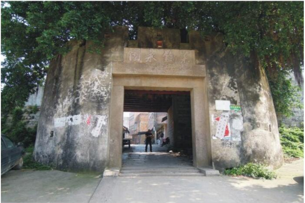
北 Q 段城墙北瓮城三合土墙体修缮前