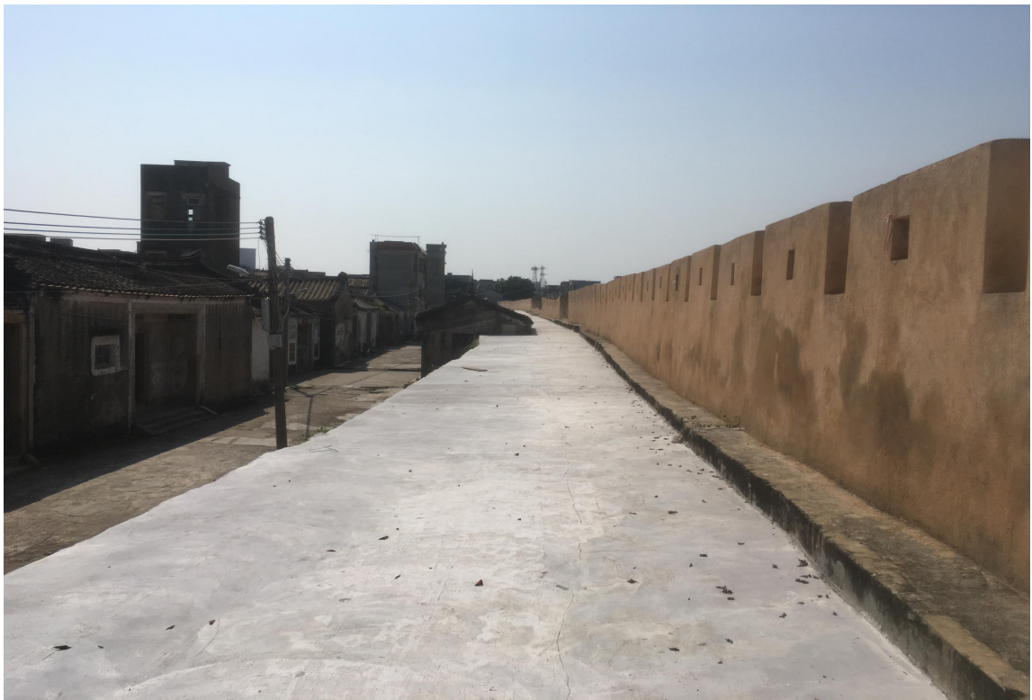
北 K 段城墙垛墙及跑马道修缮后