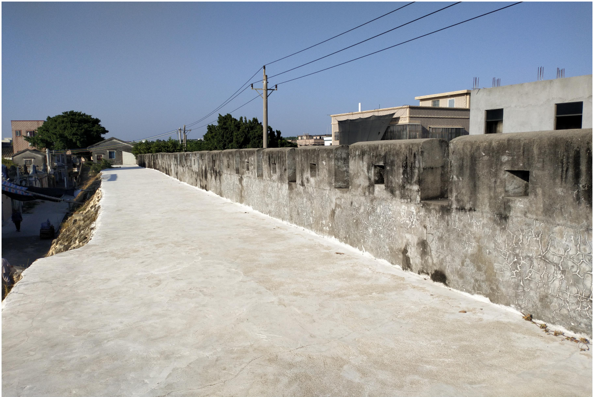
东 B 段城墙三合土墙垛修缮后