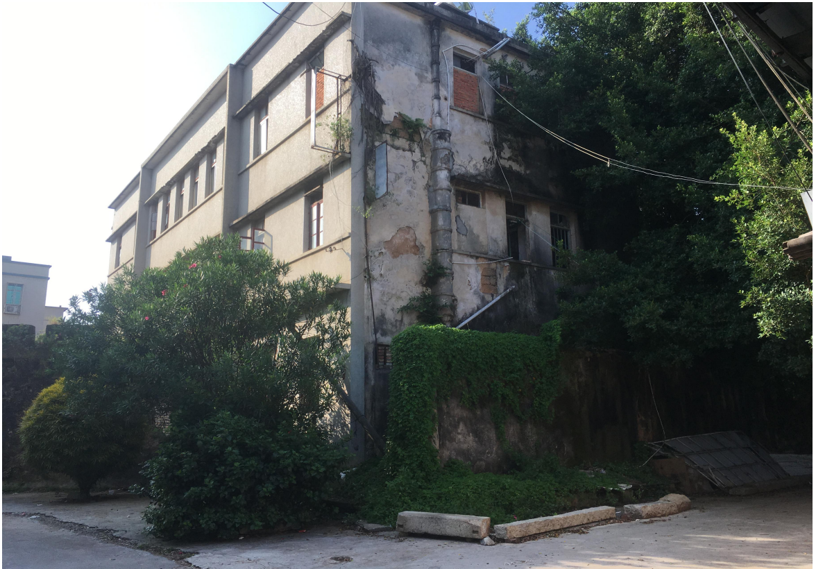
西遗址段门楼修缮后