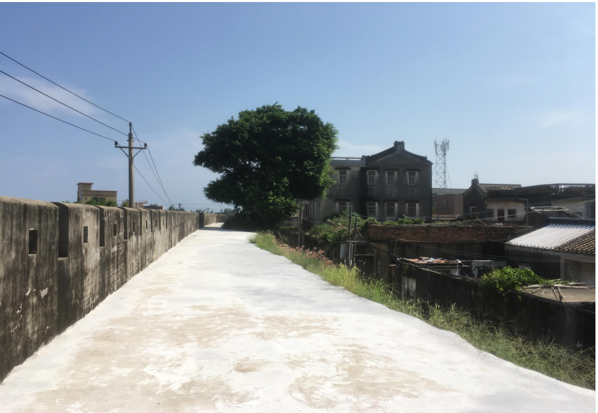
东 B 段城墙垛墙及跑马道修缮后