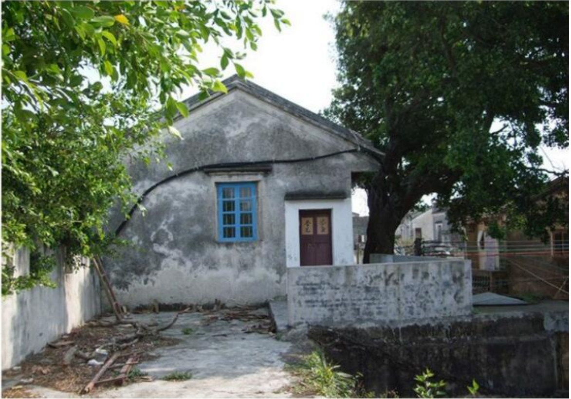
东 E 段东城门三合土墙、三合土地面修缮前