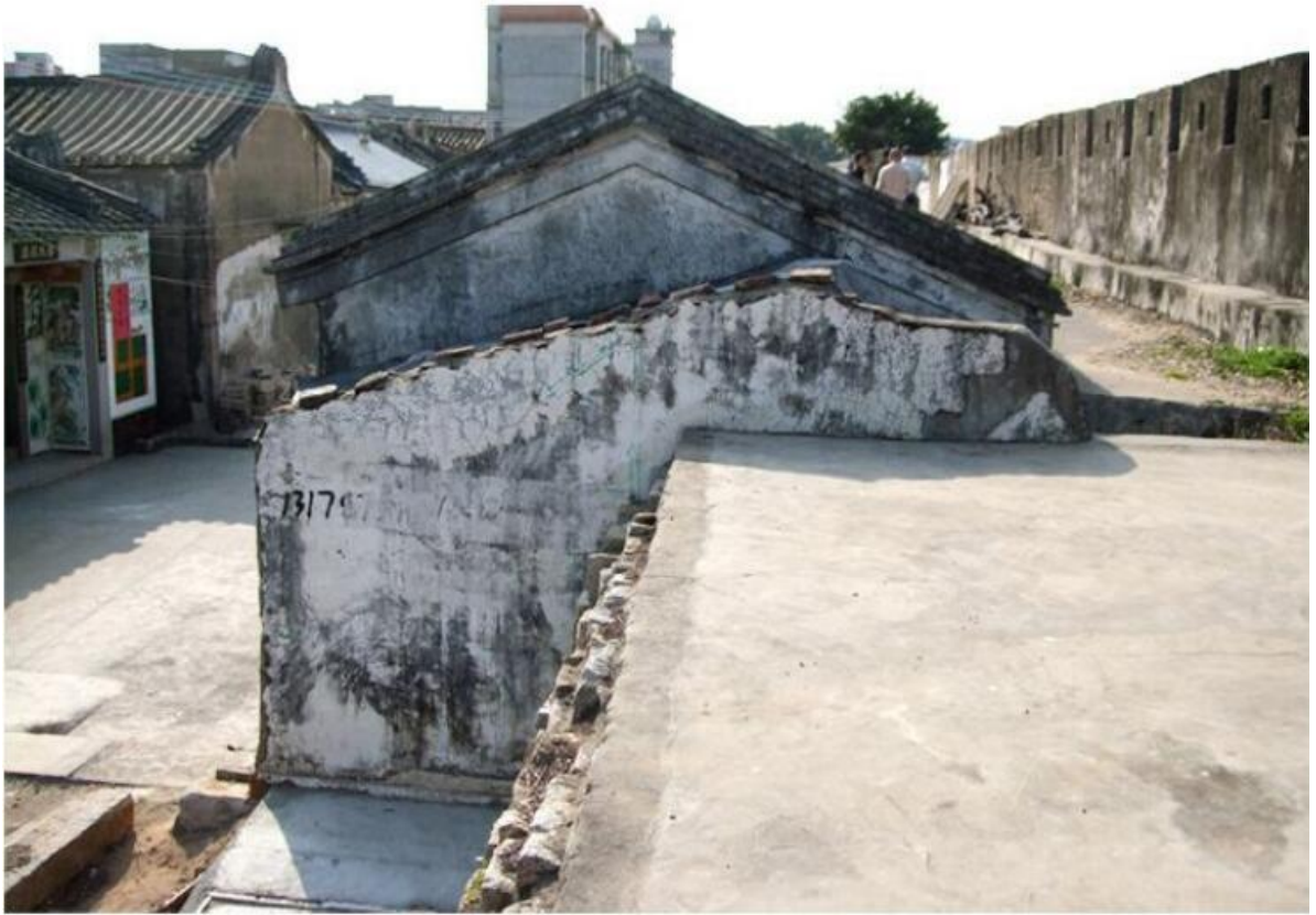
东 K 段城墙垛墙及跑马道修缮前