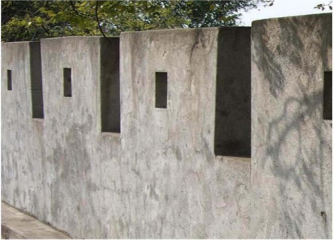
北 H 段城墙三合土墙垛修缮前