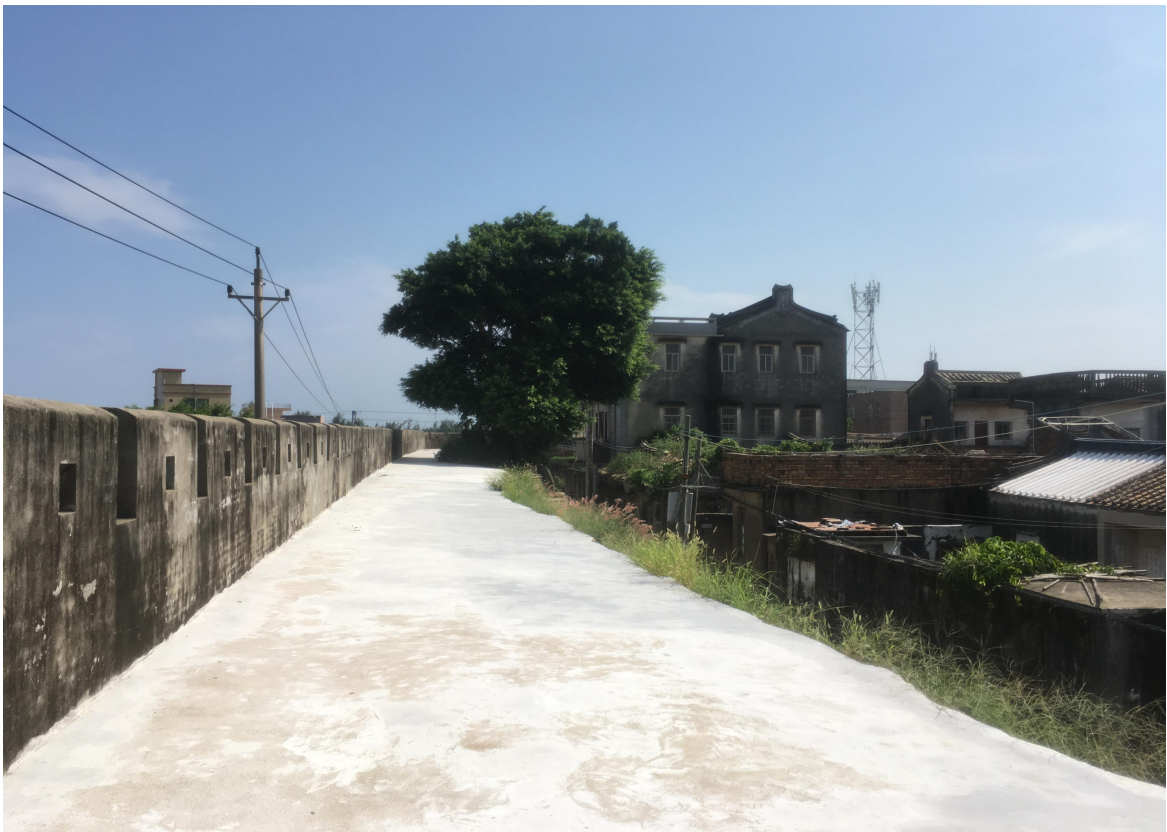
东 C 段城墙三合土墙垛修缮后