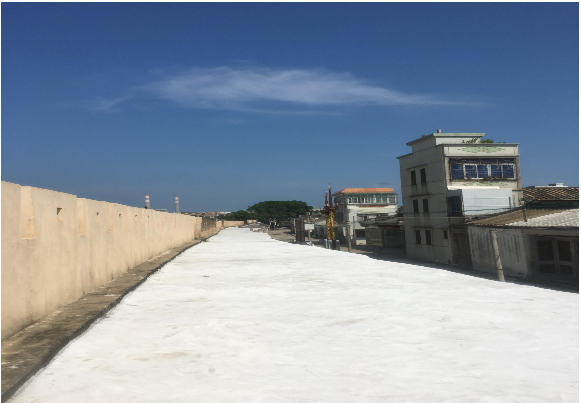
北 M 段城墙垛墙及跑马道修缮后