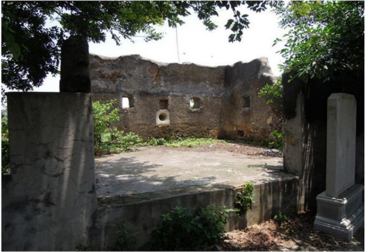
东 G 段城墙东北角楼三合土墙修缮前