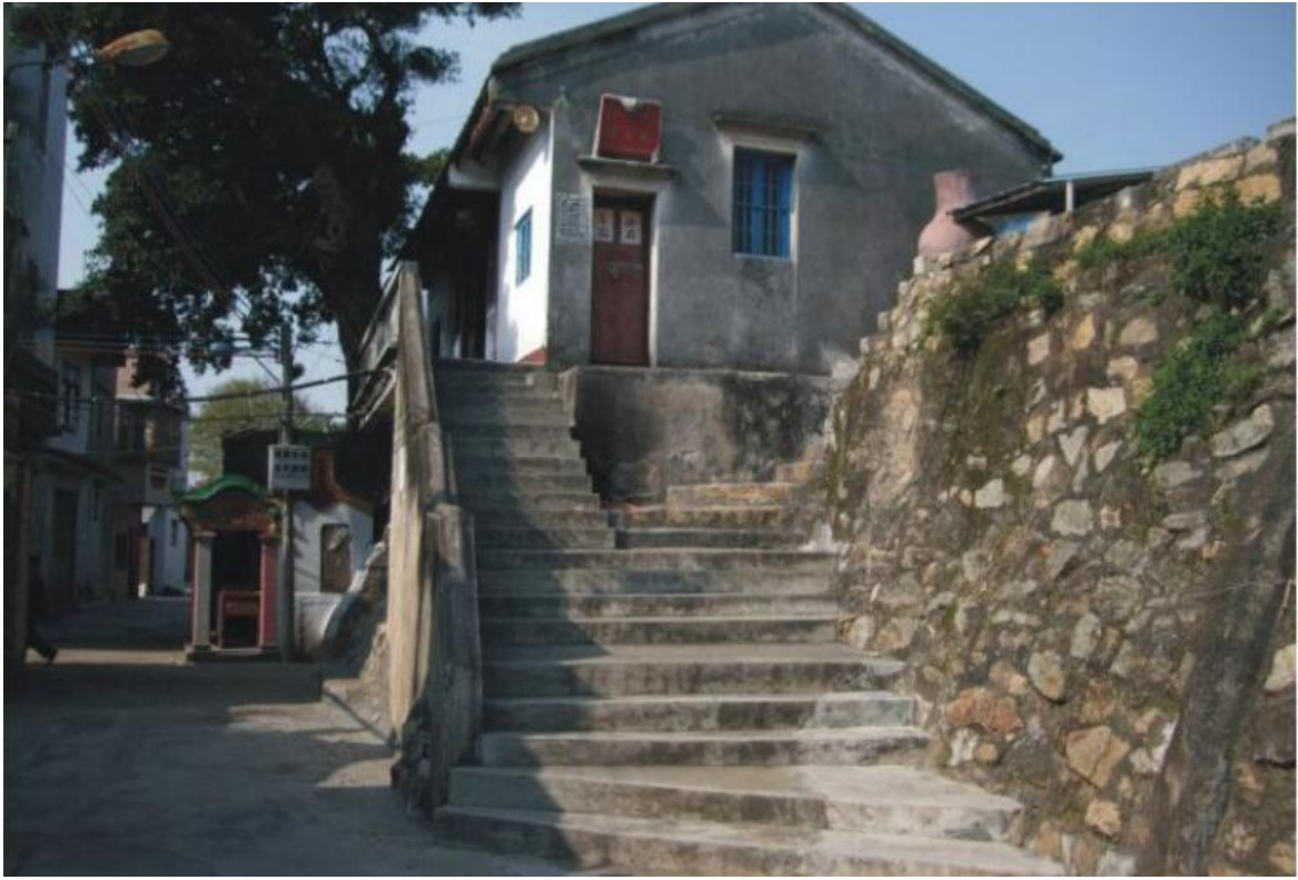
东 E 段东城门花岗岩石墙（虎皮石墙）修缮前