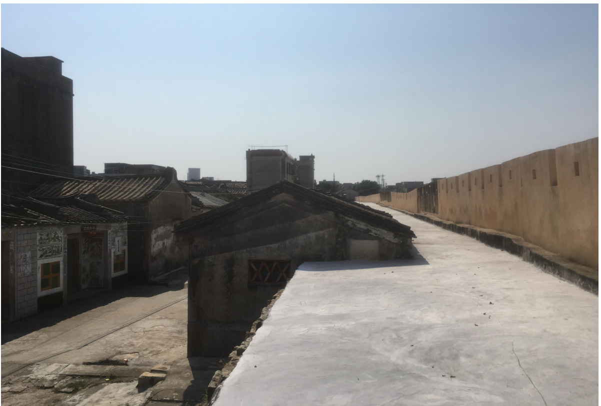
东 K 段城墙垛墙及跑马道修缮后