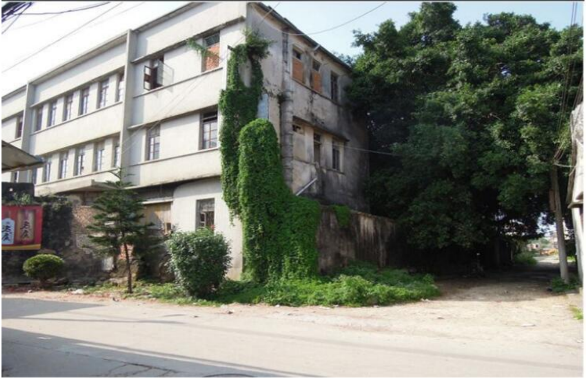
西遗址段门楼修缮前