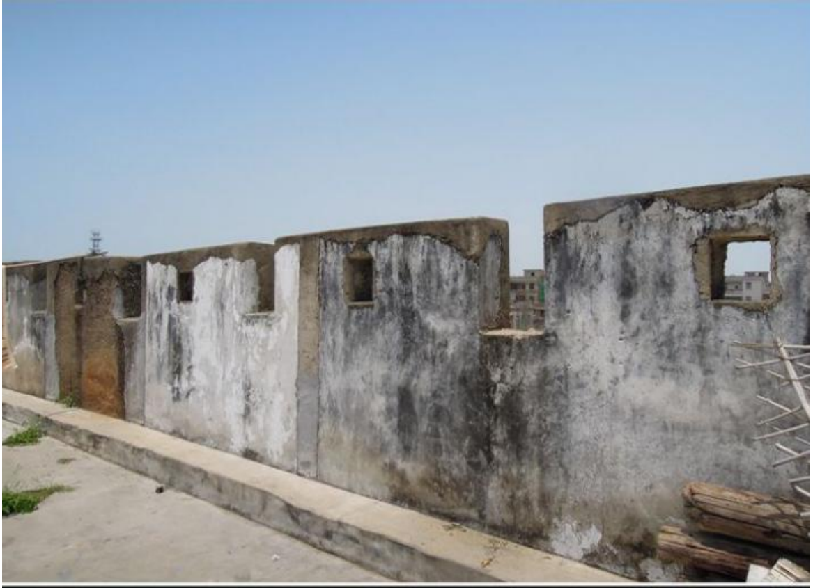
北 M 段城牆三合土牆垛修繕前