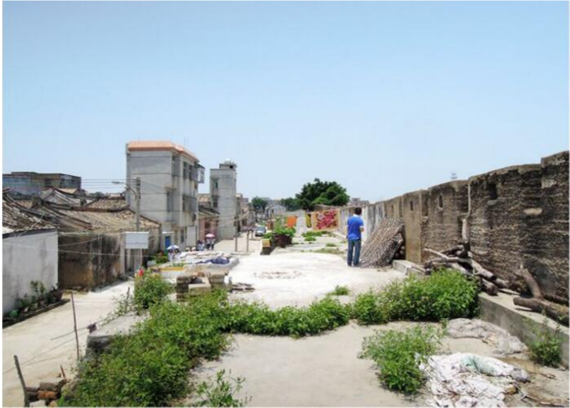
北 L 段城墙垛墙及跑马道修缮前