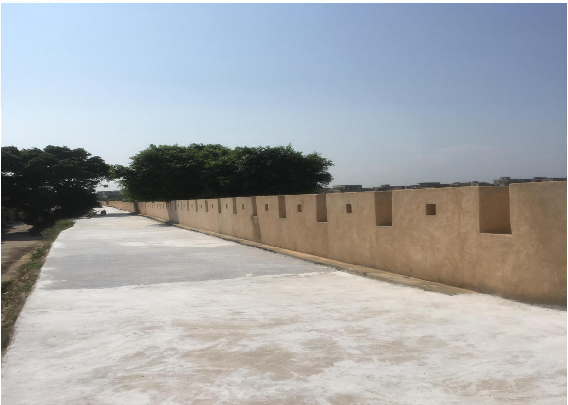
东 H 段城墙垛墙及跑马道修缮后