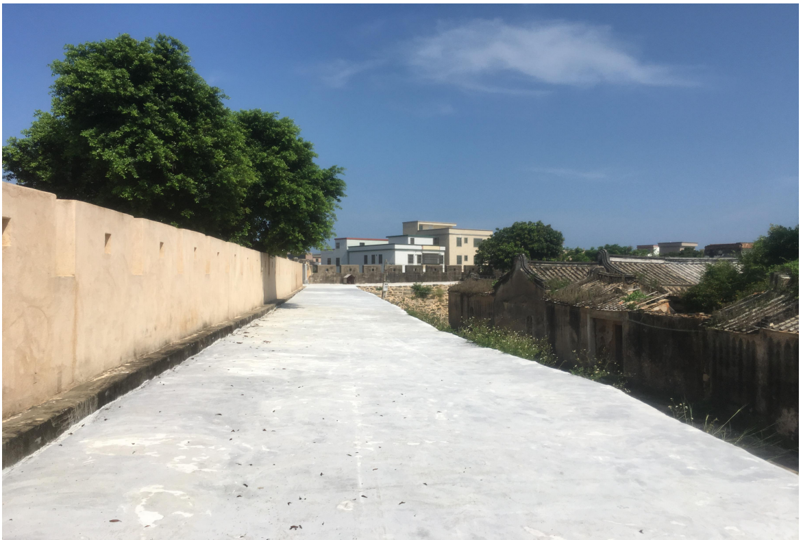
东 J 段城墙垛墙及跑马道修缮后