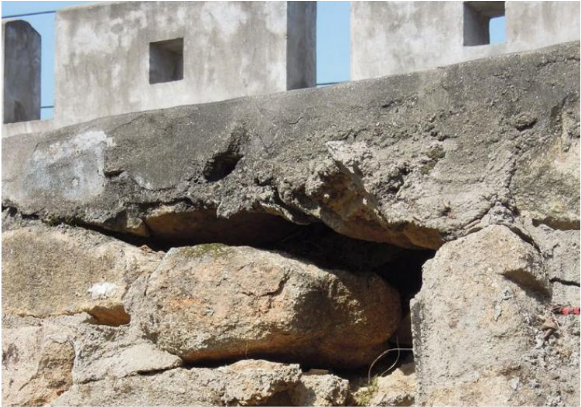
北 M 段城墙花岗岩石墙（虎皮石墙）修缮前