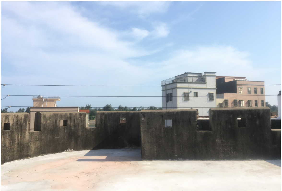
东 A 段城墙三合土墙垛修缮后