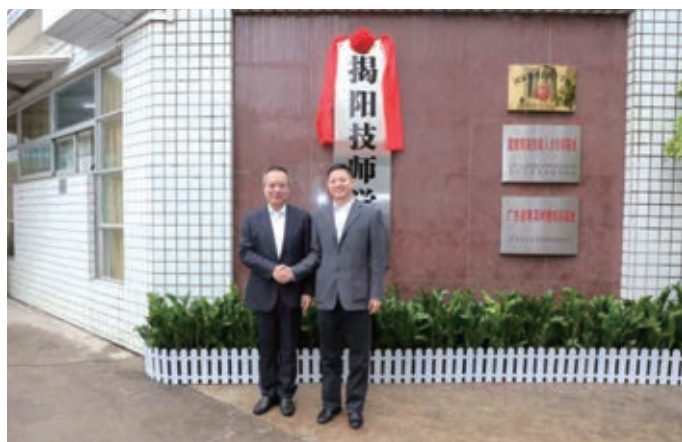
市长支光南，省人力资源和社会保障厅副厅长葛国兴为揭阳技师学院揭牌