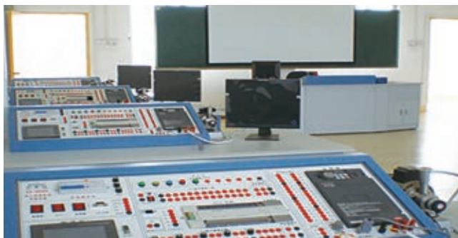
电工技师综合实训室