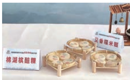
作品《棉湖槟榔糕》荣获第四届粤港澳大湾区“粤菜师傅”技能大赛一等奖