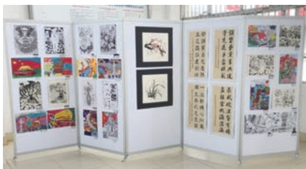
“庆祝中国共产党成立100周年”书画作品展