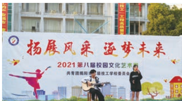
第八届校园文化艺术周