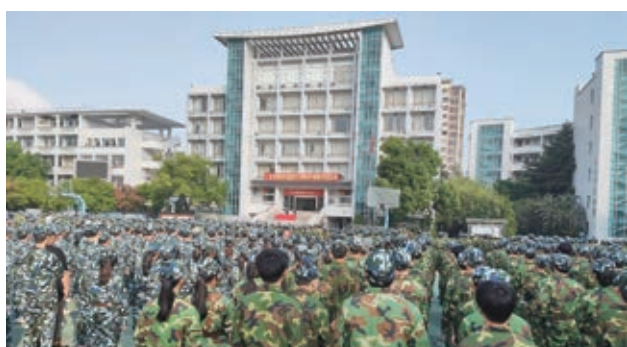
新生入学素质教育