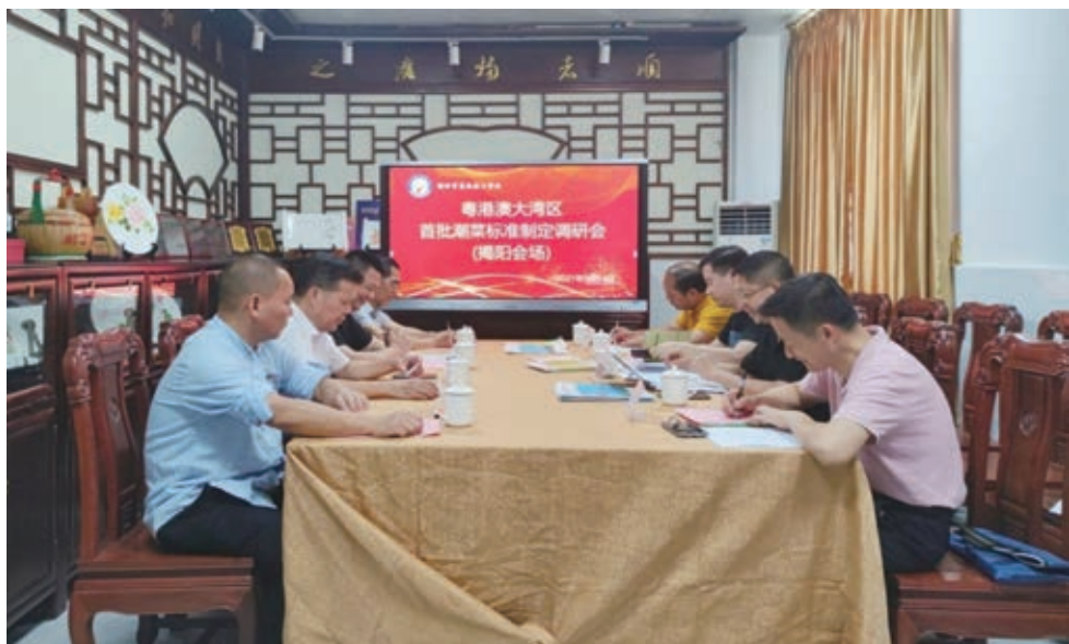
学院成为大湾区首批潮菜标准制定单位

上海潮州府餐饮管理有限公司、揭阳迎宾馆、揭阳东湖大酒店、揭阳格林豪泰酒店、揭阳商之都增海珍酒楼。