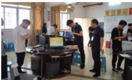
计算机网络应用技能节组网竞赛

广东中视传媒有限公司、创伊视觉传播有限公司、广州恰逢文化传播有限公司、恒竹视觉传播有限公司。