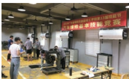
汽车基本技能实训