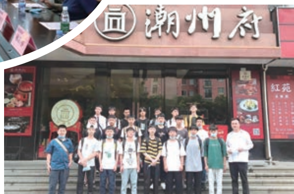
上海潮州府认识实习