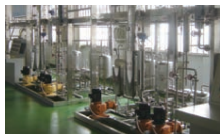
石油天然气冷凝、冷却实训