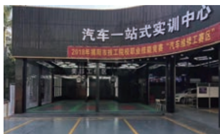
汽车一站式实训中心