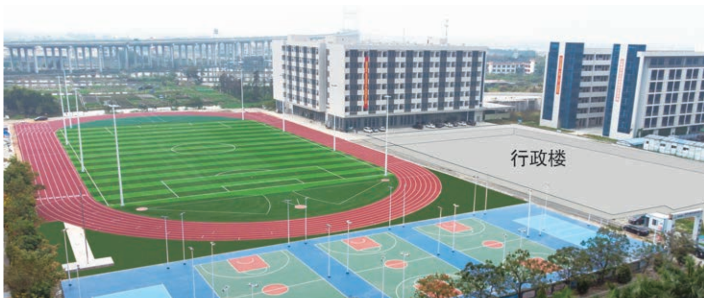
在建南校区全景图