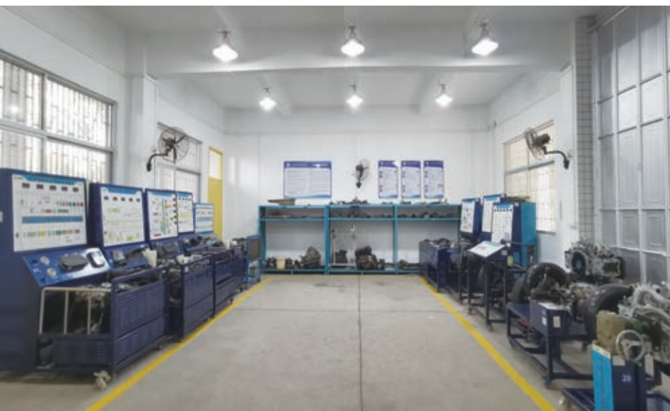
新能源汽车结构原理与检修实训