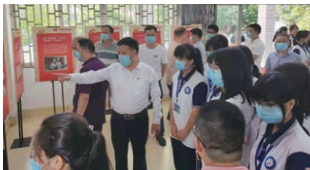
“伟大征程 光辉粤迹”党史学习活动