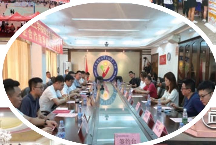
第三届校企合作委员会