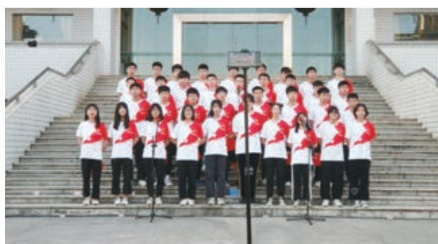
《我的中国心》合唱比赛