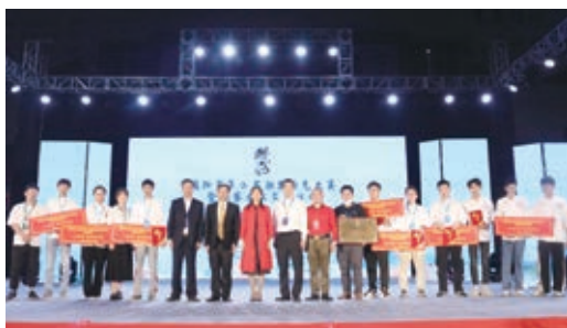
荣获“揭阳市第二届潮客厨艺大赛暨潮客文化交流活动”一等奖1项、二等奖3项、三等奖3项、优秀组织奖

学院采用ISO9001管理体系，教学质量稳步提升。近三年学院教师拥有国家级专利10项；教师获市级以上教科研成果及荣誉奖励147项，其中国家级15项、省级62项、市级70项；学生获市级以上技能竞赛42项，其中国家级3项、省级15项、市级24项。