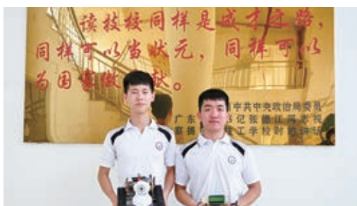
学生作品《“探路者”搜救机器人》荣获全国职业学校创新创业大赛“二等奖”