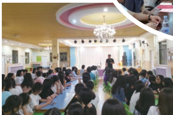
学生到深圳大宝幼儿园实习基地实习