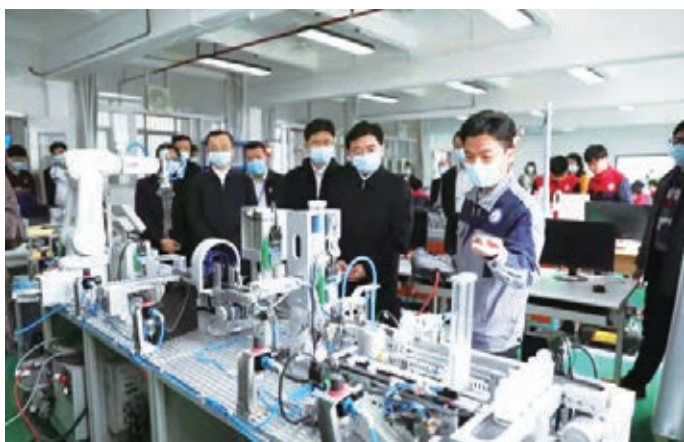
广东省政协主席王荣率队到我院调研