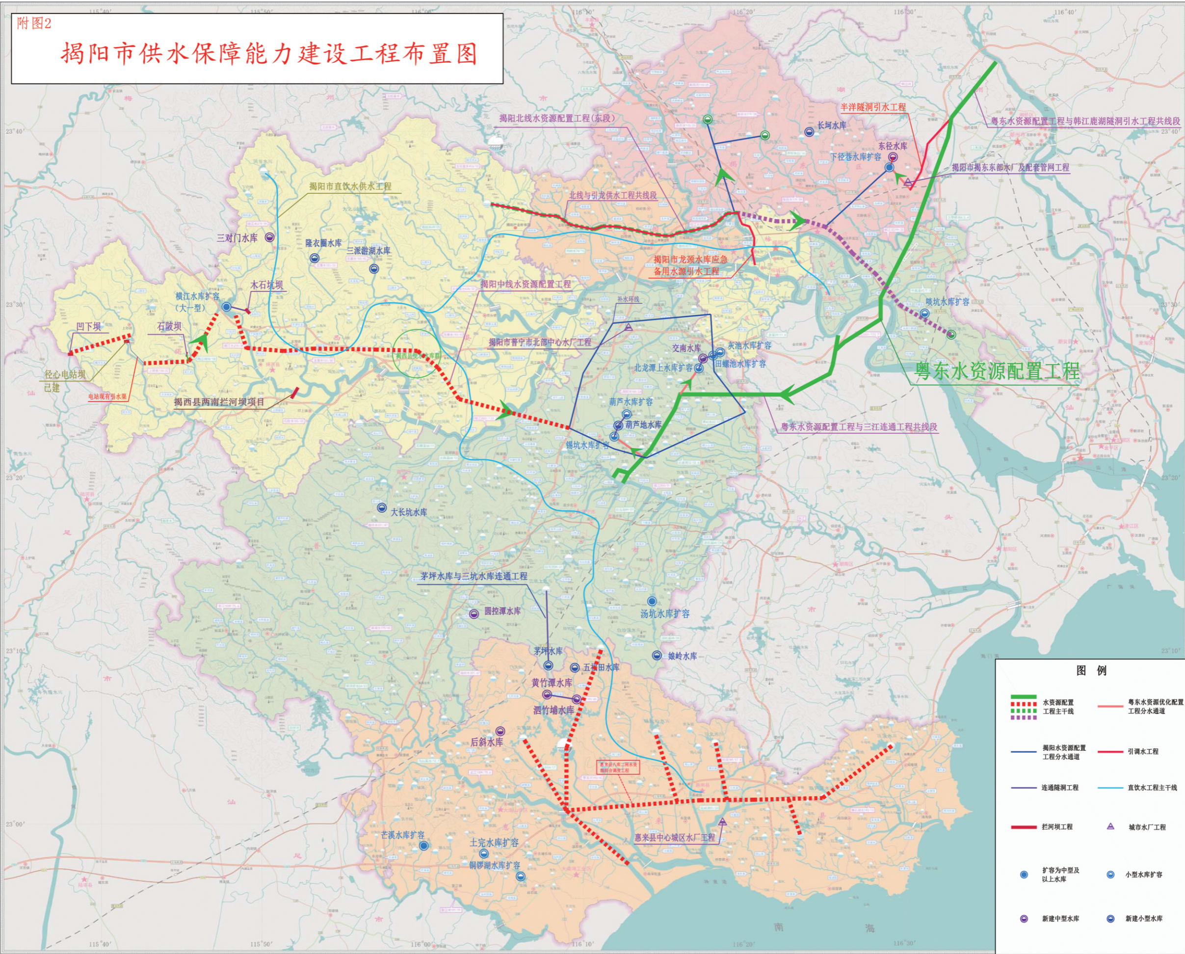
附图2 揭阳市供水保障能力建设工程布置图